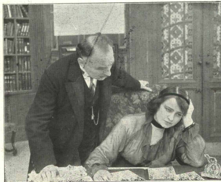
I Vé og Vaande.

Paa Vejen bliver han imidlertid ramt af en Indfødts giftige Pil. Han kommer under Tag hos Richard Williams, og her udaander han.