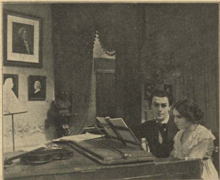
Paa Lykkens Veje.

Og da nu Tilfældet bringer hans og Ellens Veje til at