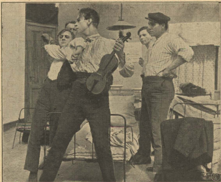
Blandt grove Kammerater.

Men om det skal blive til Lykken . . . derom kan ingen spaa. — — —