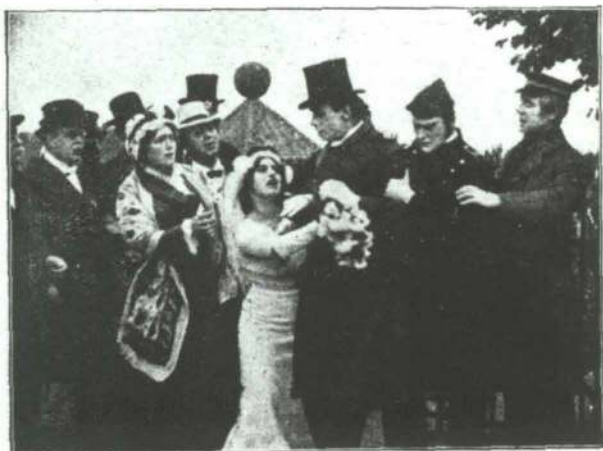
„De er anholdt!“

Rudolf og Clara har allerede fastsat deres Bryllupsdag, da Komtesse Olga en Dag overrasker Rudolf, netop som han er i Færd med at skrive til Clara om endnu engang at møde sig paa det sædvanlige Mødested ved den gamle Pavillon.