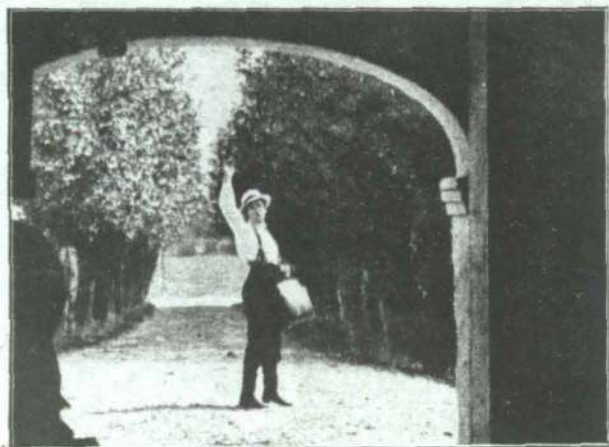
Farvel til Hjemmet.