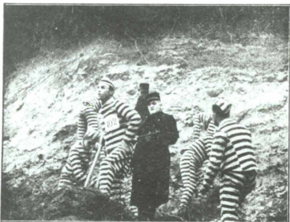
Fangerne paa Strafarbejde.

Pludselig rejser hun sig og sniger sig ubemærket ud i Haven. Skjulende sig bag Buske og Træer styrter hun ned til Have-Pavillonen.