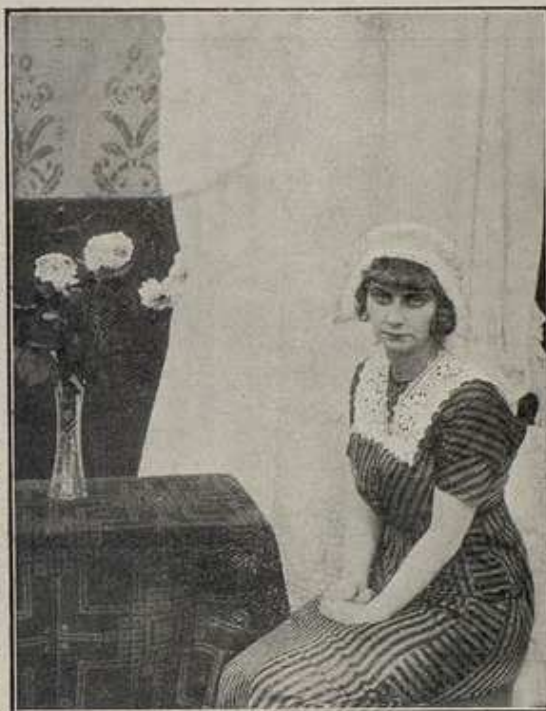
MONOPOL - Drama en los aires

Las emocionantes escenas de este drama y el atrevido desempeño por parte de los artistas que hace que el público elogie la marca MONOPOL como una de las mejores marcas cinematográficas.