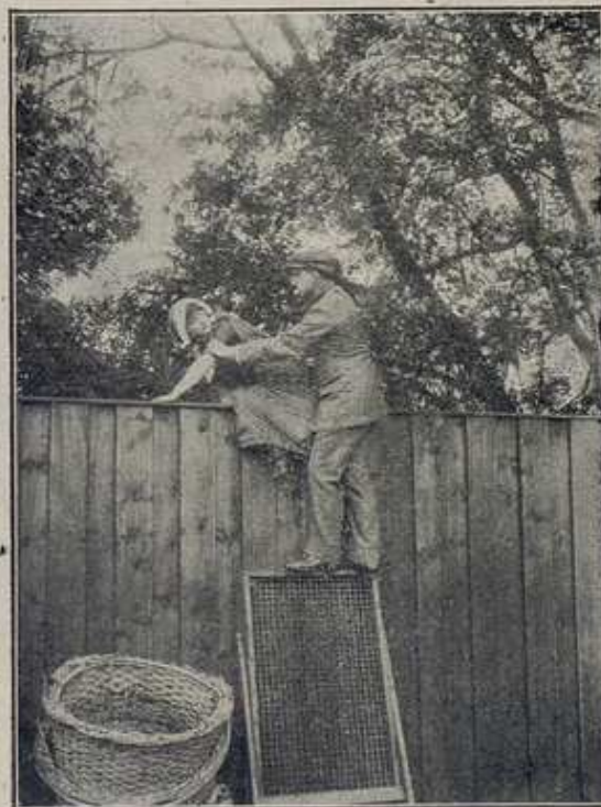
MONOPOL - Drama en los aires