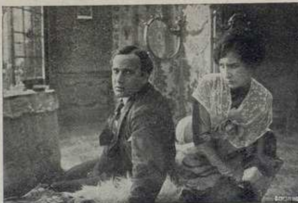
PASQUALI.—La tela de araña

En la real fábrica de porcelana, de Copenhague, trabaja como decoradora la bella Marta en compañía de su padrastro. El amo de la fábrica, prendado de su hermosura, la asedia continuamente para lograr sus favores. Marta que sabe que peligrará su honradez, sólo espera llegar a la mayor edad para tener el amparo de las leyes, puesto que su padrastro sólo sirve para trabajar. El momento deseado ha llegado y la pobre niña que no tiene a