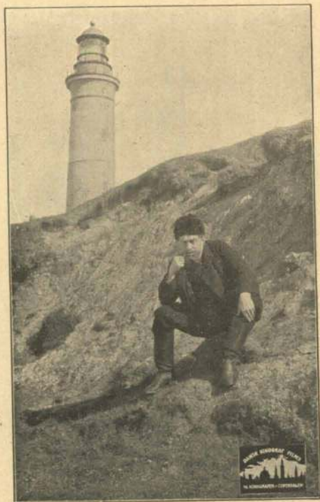
Fyrmesteren ved det store Fyrtaarn.