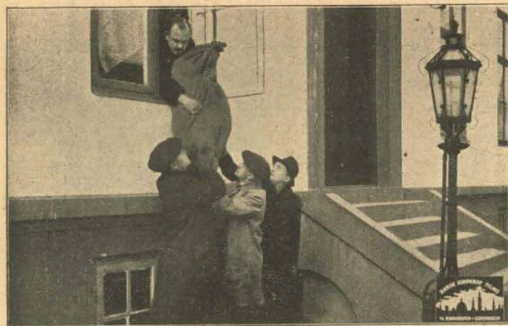
Den mystiske tunge Sæk.

Men den unge Pige, der kender den frygtelige Hemmelighed, lader sig ikke holde tilbage af saa lidt. Ad et Tov, der findes i Huset, firer hun sig ned fra sit Værelse, og alt hvad hendes Ben kan bære hende, løber hun nu ad Godset til for at advare Godsejeren.