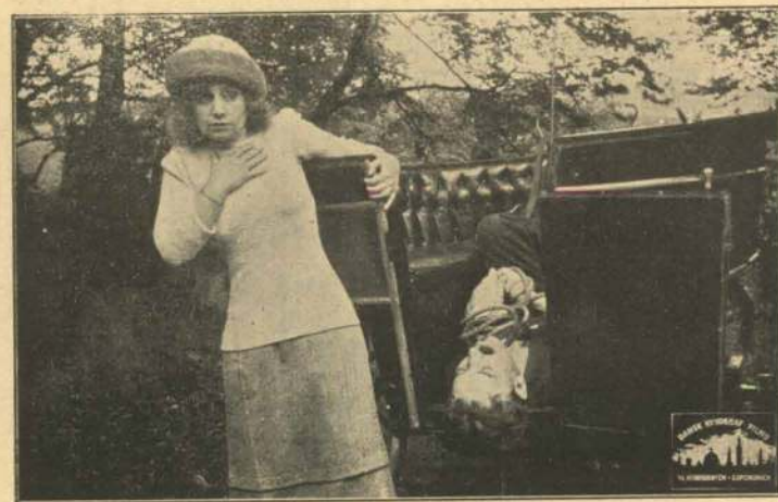
Et frygteligt Møde.

Da hun er kommet sig af sin Rædsel over det Syn, hun har mødt paa Vejen, slaar en Tanke ned i hende, en Mulighed for at redde den unge Godsejer. Med Liget af Aagerkarlen i Vognen kører hun hen til det frygtelige Skur, putter det livløse Legeme i en Sæk og giver med en Lampe