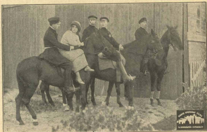
Tilhest med Politiet.

Men Fyrmesteren er jo ude paa Havet, og den gengældende Skæbne er ogsaa ved at slaa Klo i ham. Da han vil kaste den tunge Byrde i Vandet, faar han Overbalance, og Havet beholder