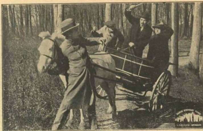
Overfaldet paa Aagerkarlen.

lemmer taget Aagerkarlens Klæder paa, og med hans Papirer i Lommen gaar han op paa Godset. Planen lykkes. Han faar udbetalt de 60,000 Kr. Og da Godsejeren et Øjeblik vender Ryggen til, putter Forbryderen en Klump Vat ned i Telefontragten, hælder Kloroform i, og i Hemmelighed