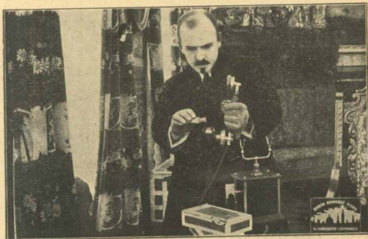
Kloroform i Telefonen.

Den snedige Plan lykkes kun alt for godt. Lidt fra Godset tager Forbryderne Telefonledningen ned, sætter et Telefonapparat i Forbindelse og ringer Godsejeren op. Denne, der intet ondt aner,