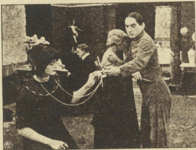
Cigaretten som Kærlighedsbrev.