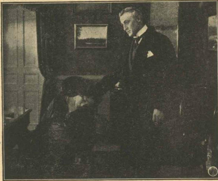
Et af Livets store Øjeblikke.

til Politikammeret, hvorfra han senere bringes til det Fængsel, hvor han er bleven dømt til at hense Resten af sit Liv.