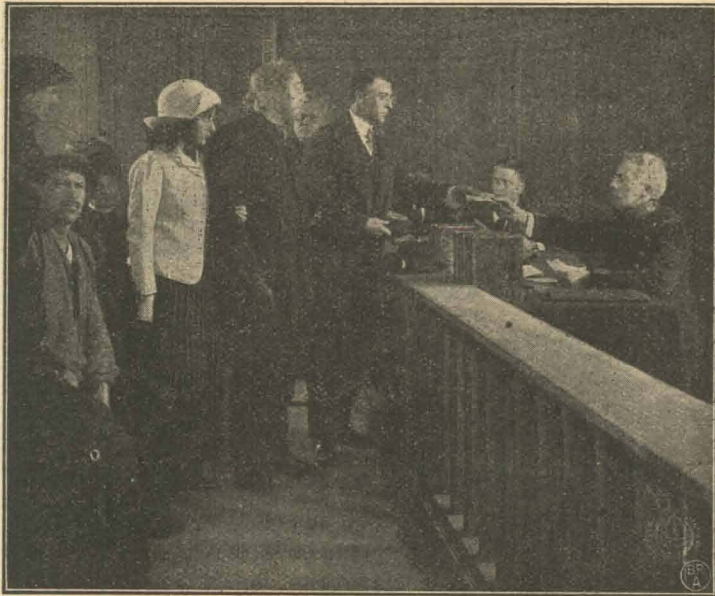
„Maa jeg betale Bøden!“

Fra Barnsben har Ella lært at elske Musikens Toner. Hendes Fader er Musiker og har engang spillet i et fint Theater. Senere er det gaaet tilbage for ham, og den gamle Musikant og Ella holder nu Hjemmet oppe ved at spille og synge i Gaardene. Ingen nok saa berømt Virtuoso kan glæde sig over et saa andægtigt lyttende Publikum som Ella, naar hun med sin sølvklare Barnestemme synger sine enkle Sange.