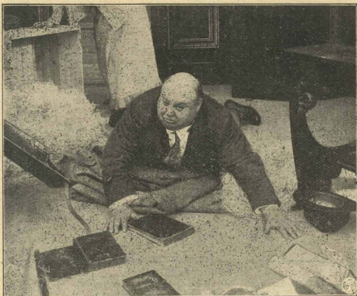
Paa alle Fire!