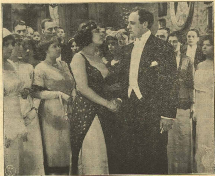
Hun takker sin Redningsmand