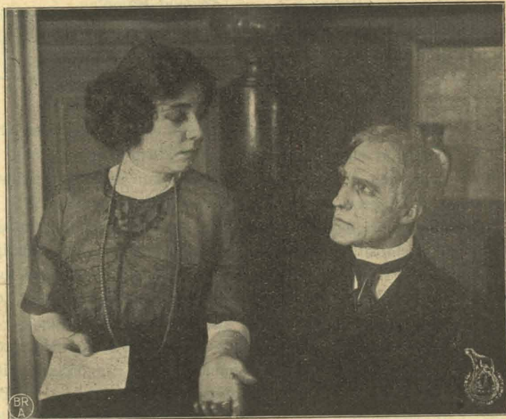
Godsejeren og hans Datter