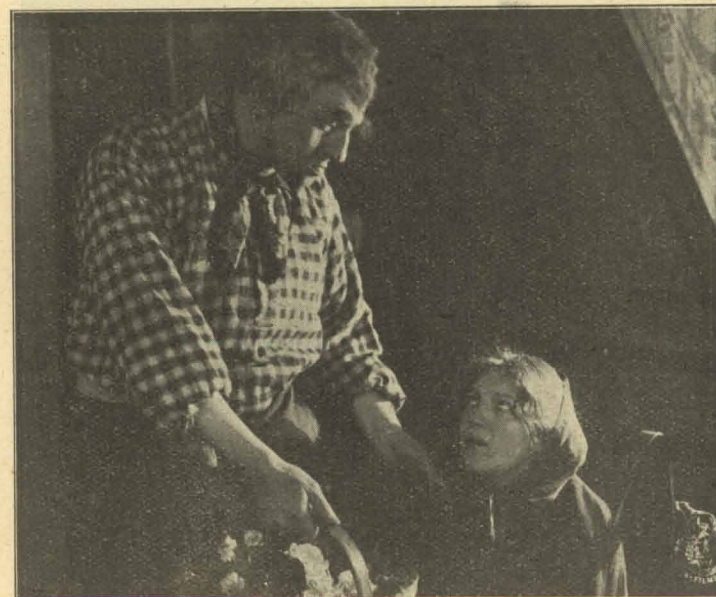
Onde Ord og Hug

Da vil Tilfældet, at han kommer forbi Irene, som er faldet i Søvn, udmattet af den isnende Blæst. Han faar en Idé —