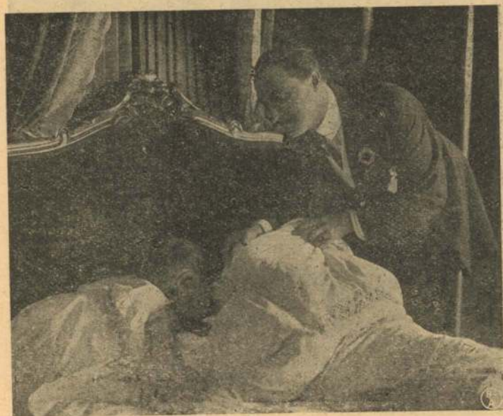
bort fra den forfærdelige Don Juan og hans lige saa forfærdelige Kammerater. Professordatteren ved selvfølgelig godt, at hun bør hade og foragte den unge Mand, der har ladet sig henrive til at sætte alle konventionelle Hensyn til Side,