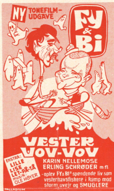
Annoncekliché nr. 3

Længde: 2772 m Censur: RØD Sort/hvid Widescreen