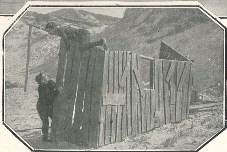
To Balherrer, som ingen vil danse med — Fyrtaarnet og Bivognen bygger Hus

Fyrtaarnet og Bivognen kommer til Egnen og forsøger sig som Fiskere. De bliver hurtigt gode Venner med Gamle Maren og Tom, der overlader dem en Jolle samt noget Drivtømmer, hvoraf de opfører et lille Hus. Fiskeriet i Vesterhavet bereder dem dog mange Skuffelser, og de faar i det hele taget at føle, at Livet ved Vestkysten ikke er lutter Spøg. Lørdag Aften er der Bal paa Kroen. Pigerne bryder sig ikke om at danse med dem, men efter at Fyrtaarnet og Bivognen har danset en elegant og stilfuld Charleston, bliver de Aftenens Balløver, hvilket i høj Grad ærgrer Søren Bak. Birthes Elskværdighed overfor Tom vækker yderligere hans Forbitrelse, og efter Ballet hævner han sig ved at overfalde den unge Fisker. Fyrtaarnet og Bivognen kommer deres Ven til Undsætning og faar i en Haandevending kuet den hovmodige »Ko'missær«.