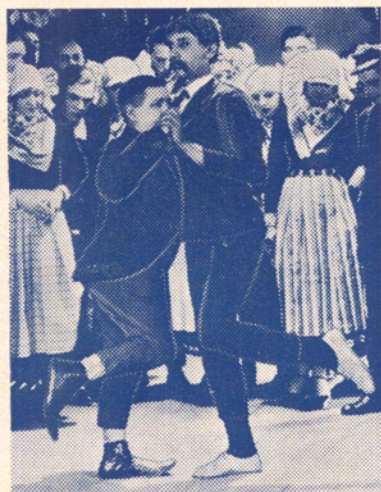
Illustrationskliché nr. 1