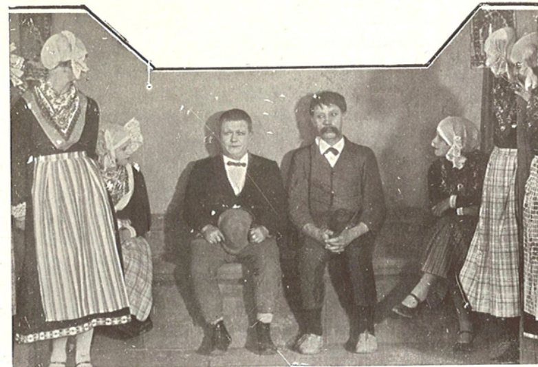
To Balherrer, som ingen vil danse med.