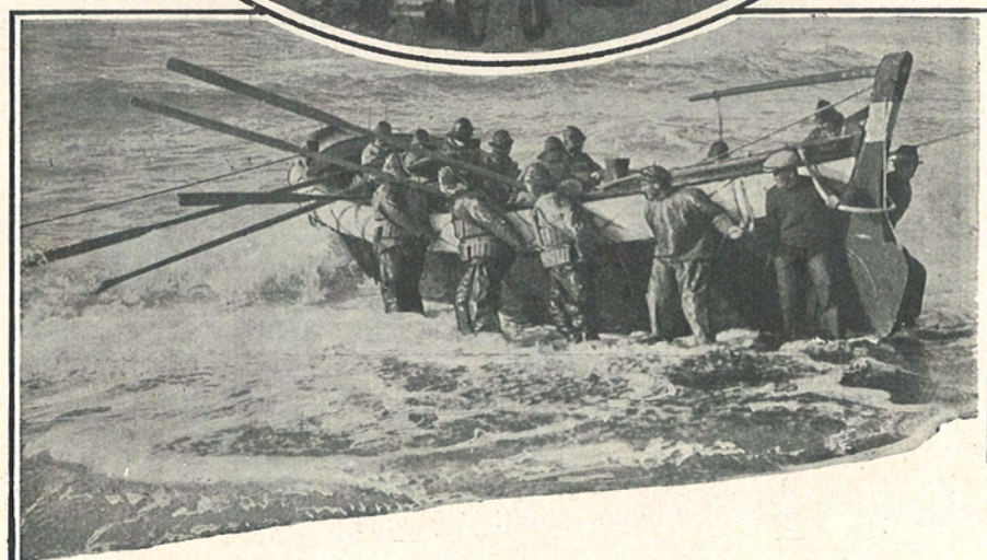
Fra Strandingscenerne i „Dester=Dov=Dov“