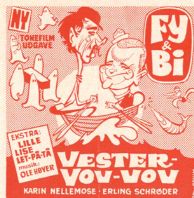
Annoncekliché nr. 2