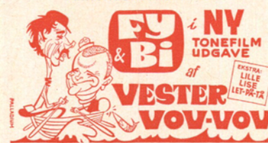
Annoncekliché nr. 1