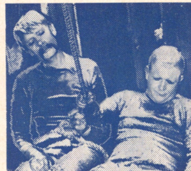
Illustrationskliché nr. 2