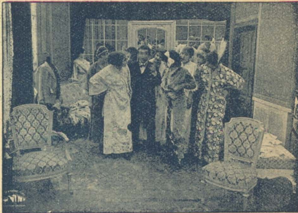
„Tænk Jer, den store Danserinde kommer!“