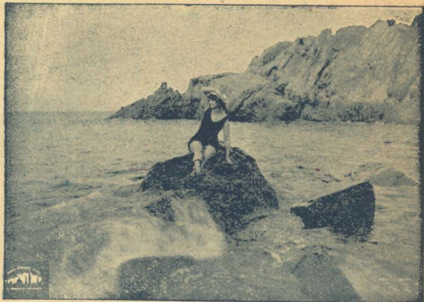
„Er det en Sirene?“

Da Adorée om Aftenen indfandt sig paa Teatret, spurgte Impresarien efter hendes Kostume. „Kostume? Det er ikke nødvendigt“, sagde Adorée og rev et Gardin ned fra Vinduet i Paaklædningsværelset — et smukt broget Stykke Tøj, afklædte sig fuldstændig og slyngede Sløret om sig med