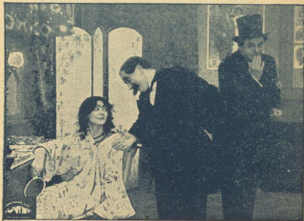
„Jeg danser kun, dersom Prinsen kommer.“

Og saa gik hun ned paa Scenen og dansede