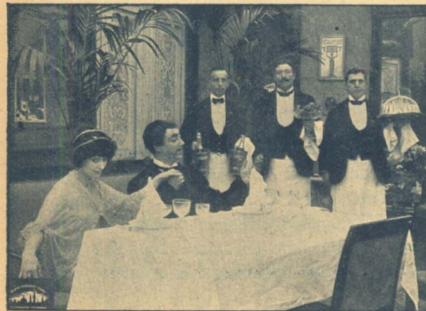
Souperen efter Forestillingen.

Næppe var hun kommen ind ad Døren, før hun fik Skyggesiden af sin Berømmelse at føle. — Telefonen begyndte nemlig at kime, og Journalister, Grosserere o. s. v. inviterede hende ud eller vilde interviewe hende, hvilket Adorée