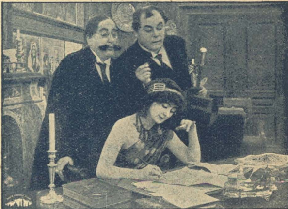
Adorée underskriver Kontrakten.

Da ringede Telefonen i Hovedkontoret, og