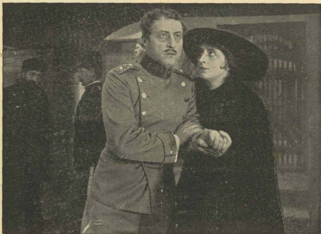
En hemmelig Meddelelse i Fæstningen Zora's underjordiske Celler.

»»»»»»»» OPTAGET AF DEN DANSKE FILMFABRIK „KINOGRAFEN“, KØBENHAVN ««««««««