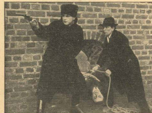
Den saarede Ven hjælpes ud.

Han gør ikke dette for at bringe Egan i Forlegenhed, men kun for at forhindre, at hans Plan, ved en Indgriben fra Politiets Side, skal mislykkes. Hans Anelser slaar til. Politispionerne, der er mødte op ved Festen, foretager en Undersø-