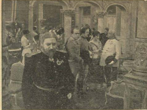
Den Aften, da „Gerningen“ skal udføres.