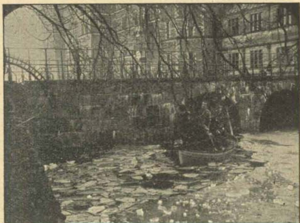
Fangen befries Vagten allarmes.

Det lykkes dem at naa frem til Celledøren, Vagterne, de har passeret, er gjort stumme, men den sidste Vagt er aarvaagen. Et Skud glimter i