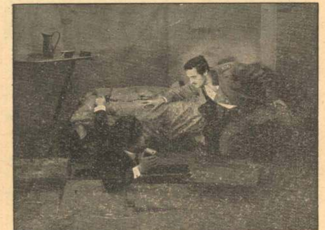
Da Cellens Gulvflise løftede sig op.

Den gamle Grev Orloff og hans Datter, Egans vordende Hustru, er sunket sammen i Fortvivlelse over det ufattelige, der er sket. De tror paa Egans