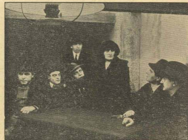
„— Fol! Ingen Uskyldig skal straffes for vor Skyld!“

Fyrsten og hans Mænd har imidlertid vaagne Hjerner til Disposition; det hemmelige Møde, som har fundet Sted i et mystisk Lokale bag en gammel Jødes Skomagerværksted, er blevet beluret