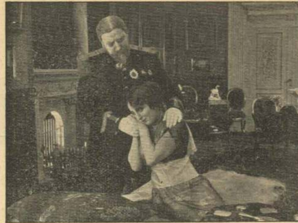
Den ulykkelige unge Pige.

Det er først nu, da han begiver sig til Festen og føler Bomben — Døden — i sin Lomme, at han indser, hvad det er for rædselsfulde Tanker,