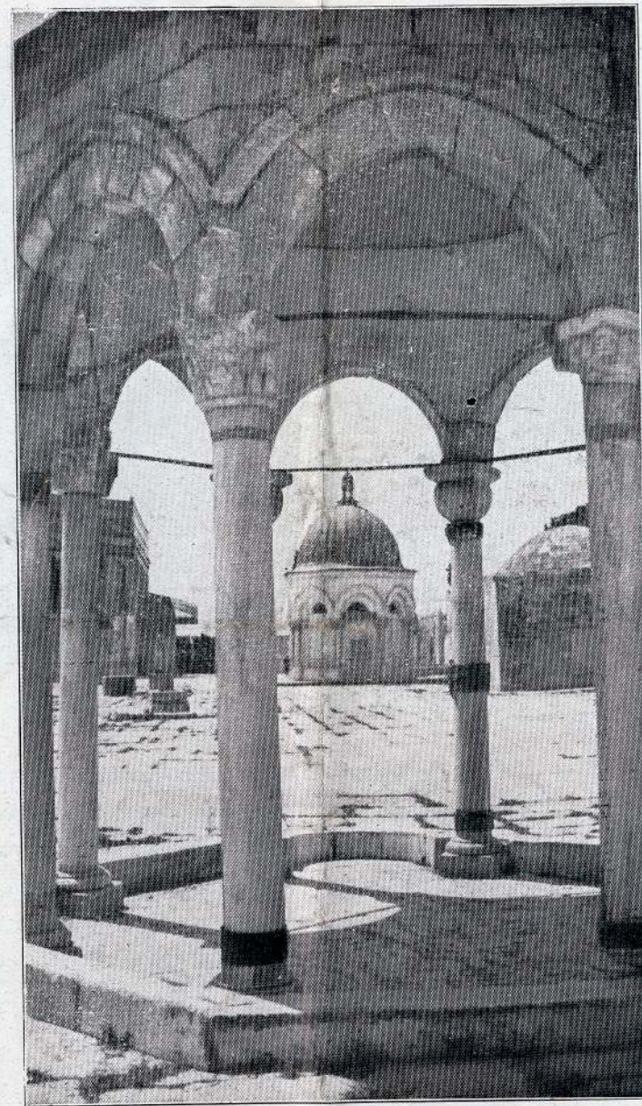
AANDEKUPPELEN PAA TEMPELPLADSEN I JERUSALEM

Militær hugger ind svingende Flodheste-piskene. Selve Gravkirken føres man ind i, hvor hver Plet fra Gulv til Kuppel er besat af en broget, myldrende Menneskemasse, der venter, at — Underet — den hellige Ild