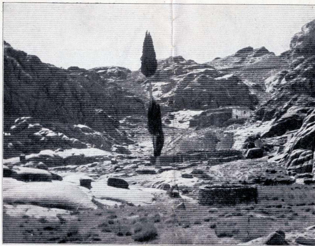
KÆMPECYPRESSEN PAA SINAI BJERG, der betegnes som Stedet, hvor Gud aabenbarede sig for Moses

PALÆSTINA-FILMEN blev optaget af den danske Palæstina-Ekspedition, der blev udrustet af Generalkonsul Holger Adolph.