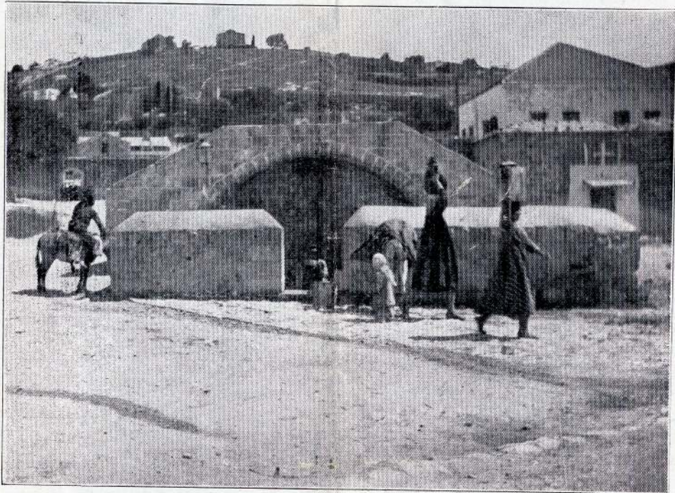
MARIAKILDEN I NAZARETH

Dette er i korte — meget korte Træk Filmens Indhold.