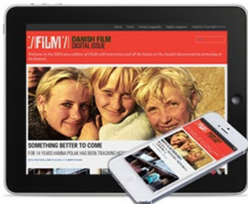
FILM Digital Issue

Det Danske Filminstitut / Danish Film Institute Gothersgade 55 DK-1123 København K www.dfi.dk