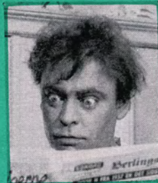
BASTIAN pressefotograf (Dirch Passer)