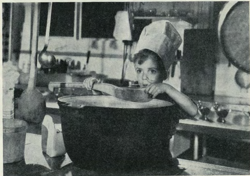
Palle forsøger at lave en stor portion havregrød!

DANSK KULTURFILM og A/S NORDISK FILMS KOMPAGNI