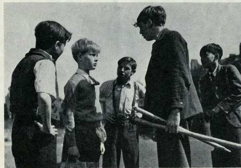
— Er panserne efter dig?