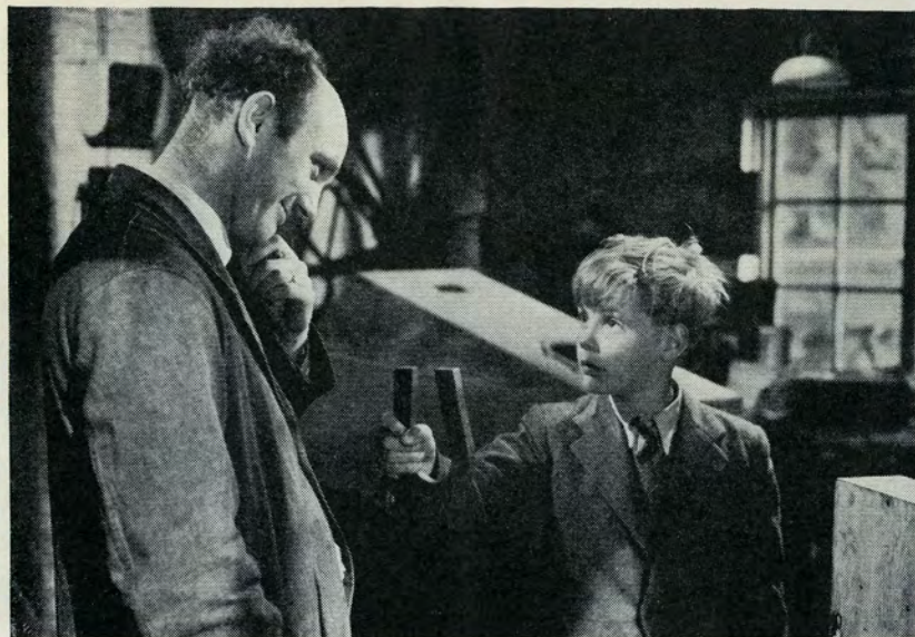
—Jeg har ingen penge, men De kan få min magnet!