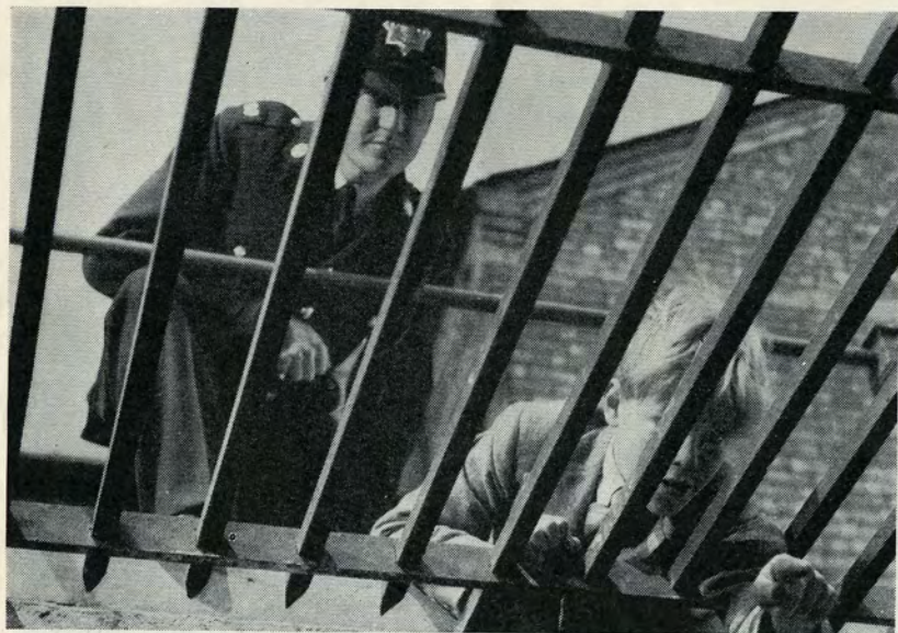
Johnny har fået kig på noget mystisk.

Drengenes anfører, Spike, er misfornøjet med at blive stillet i skygge af Johnny og udfordrer ham til at gå over en planke på en faldefærdig, gammel bro. Spike styrter ned, men Johnny redder ham fra at drukne. De føres begge til hospitalet, hvor Johnnys forældre er lykkelige over at gense deres søn. Drengen er målløs af overraskelse, da han kort efter føres ind til hospitalets bestyrelse og får en guldmedaille! Han er dog ikke videre glad for denne belønning, som han ikke synes, han har fortjent. Atter strejfer han om ved stranden, og her møder han til sin usigelige glæde den lille Kit lyslevende. Kit vil gerne have den flotte medaille. Han bruger det fif, han har lært, og tilbyder Johnny sit „usynlige ur“. Det er ikke svært for den lille fyr at overtale den anden til at gå ind på denne byttehandel. Omsider er Johnny igen den lykkelige, sorgløse dreng, han var før, han fik den ulyksalige magnet!