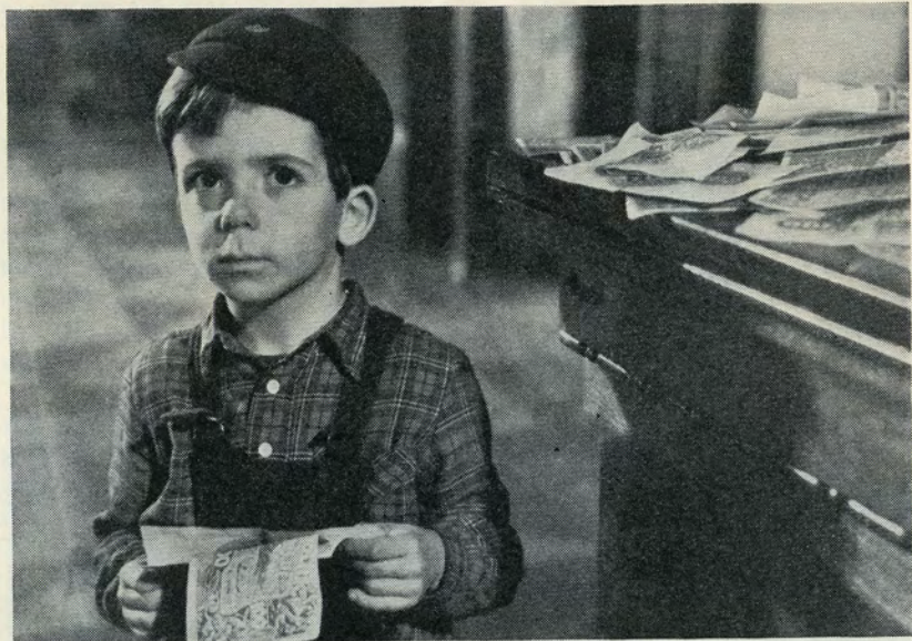
Masser af penge, men hvad skal han bruge dem til?