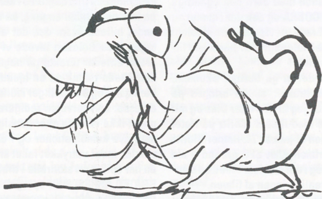
Tegning af Pierre Alechinsky. Gengivet i tidsskriftet »L'Oeil«, 1961.