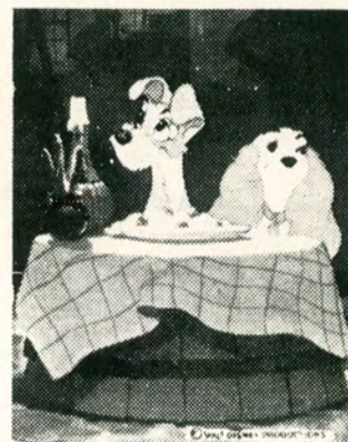
1 spaltet anmelderliché

Desuden forefindes støtteannonceliché på 4 sp. x 125 mm