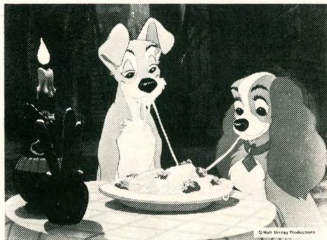
2 spaltet anmelderliché

Censur: Rød Længde: 2085 meter Cinemascope – farver