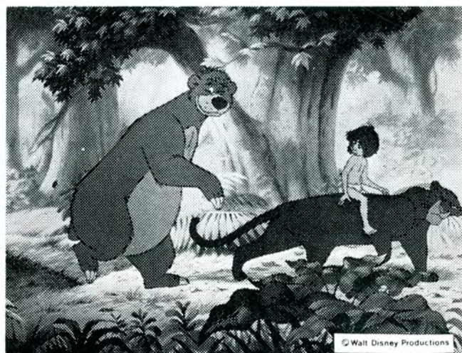
2 spaltet anmelderkliché