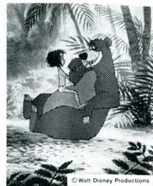
1 spaltet anmelderkliché

Desuden forefindes støtteannonceliché på 4 spalter x 150 mm