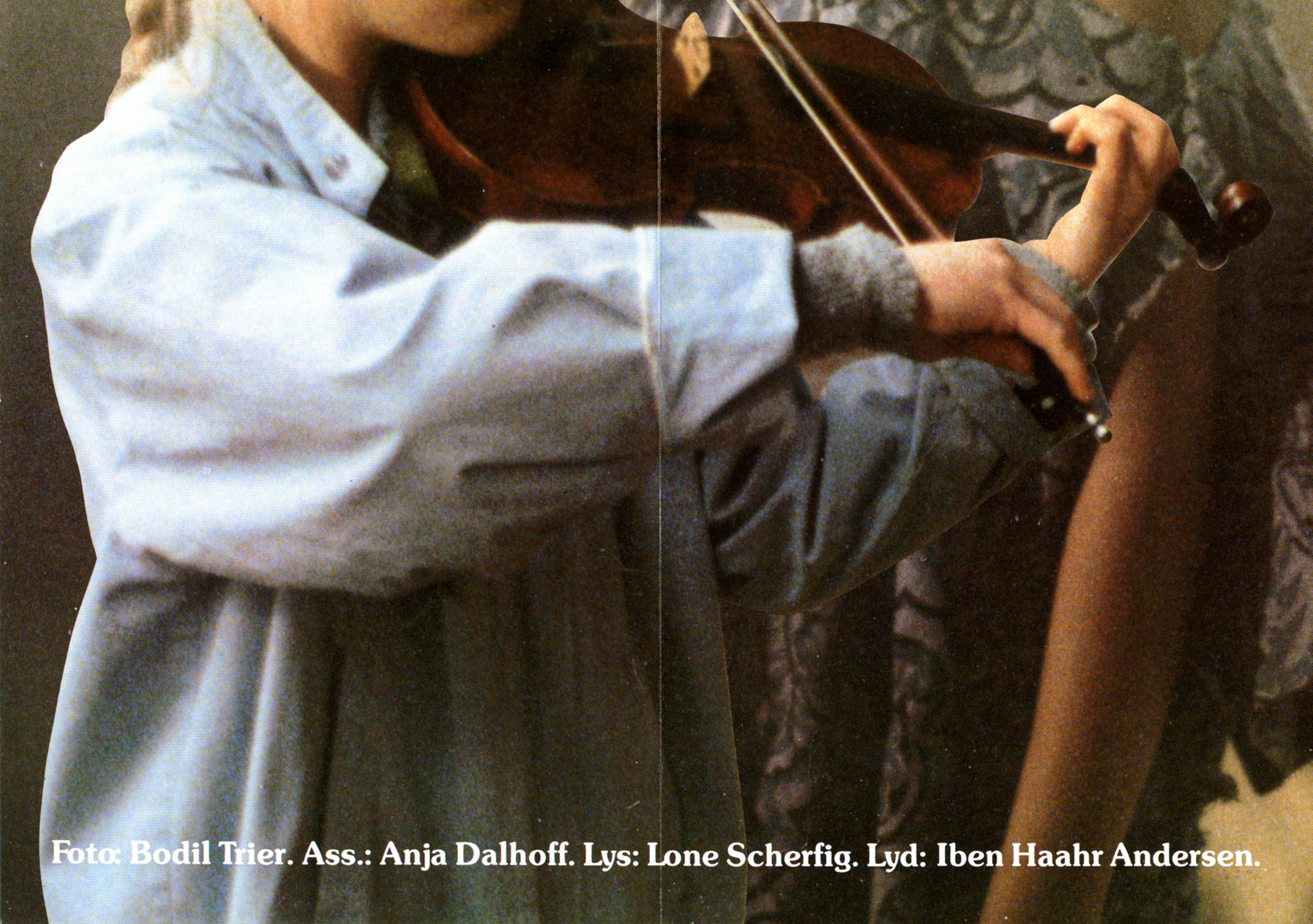
Foto: Bodil Trier. Ass.: Anja Dalhoff. Lys: Lone Scherfig. Lyd: Iben Haahr Andersen.