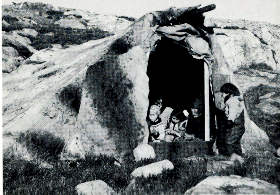
Sælskindstelt på sommerfangstplads ved Kangaatsiaq.

kulturelle fremskridt. I en tid præget af international krise og uro kunne dansk nationalfølelse samles omkring Grønland, og man forsøgte at gøre Grønland til symbol på dansk humanisme.