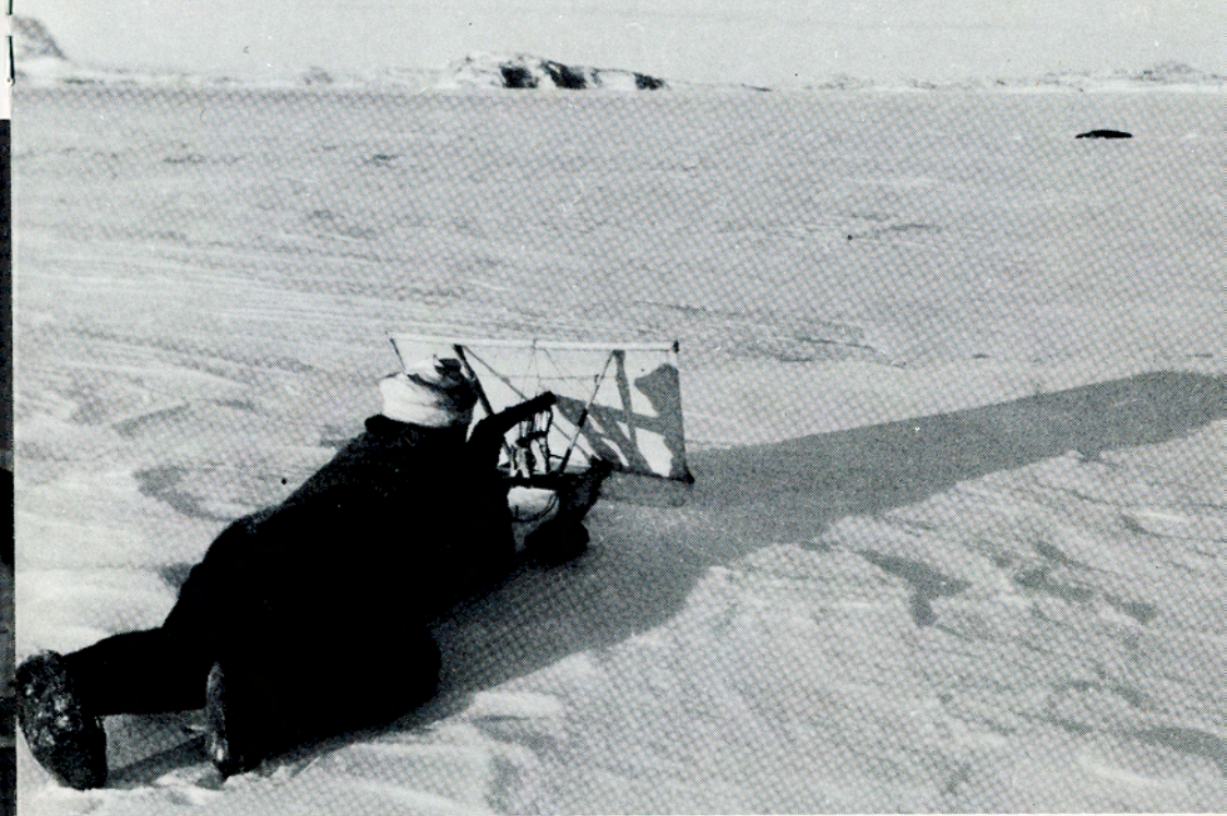
Uttoq-fangst ved Thule. Sælen ligger og soler sig på isen.