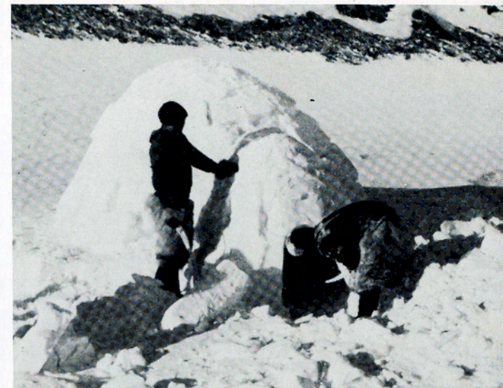
Bygning af snehus ved Thule.

identisk med den tidligere sort/hvide udgaves, medens filmens tale er skrevet af nu afdøde museumsinspektør Helge Larsen.