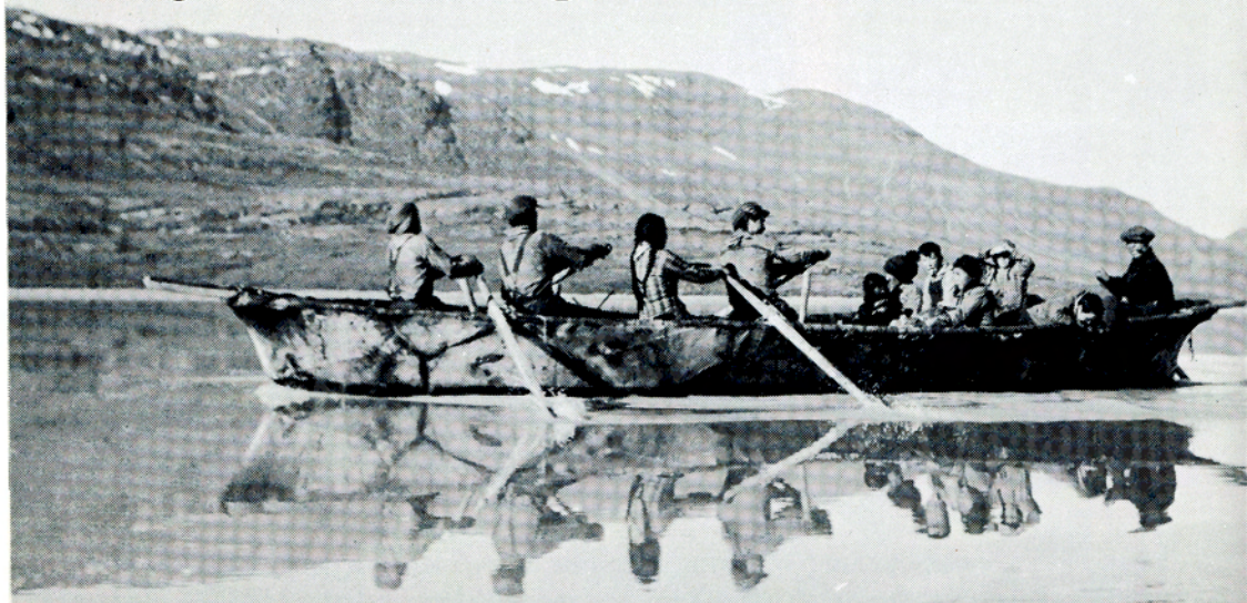
Konebådssejls ved Kuussuaq. Sammen med kajakken var konebåden tidligere et uundværligt transportmiddel for bygdebefolkningen.