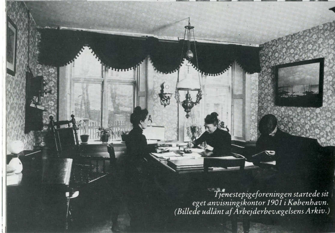
Tjenestepigeforeningen startede sit eget anvisningskontor 1901 i København.

Tjenestepigernes forhold forbedredes med den almindelige velstandstigning. Området er stadig gråt, men stort set er Tjenestepigeforeningens krav fra 1899 blevet gennemført. Iøvrigt er der ikke mange tjenestepiger mere, og forsøg på at skrue udviklingen tilbage f.eks. med love om skattefradrag for tjenestepigeløn vil forhåbentlig aldrig lykkes.