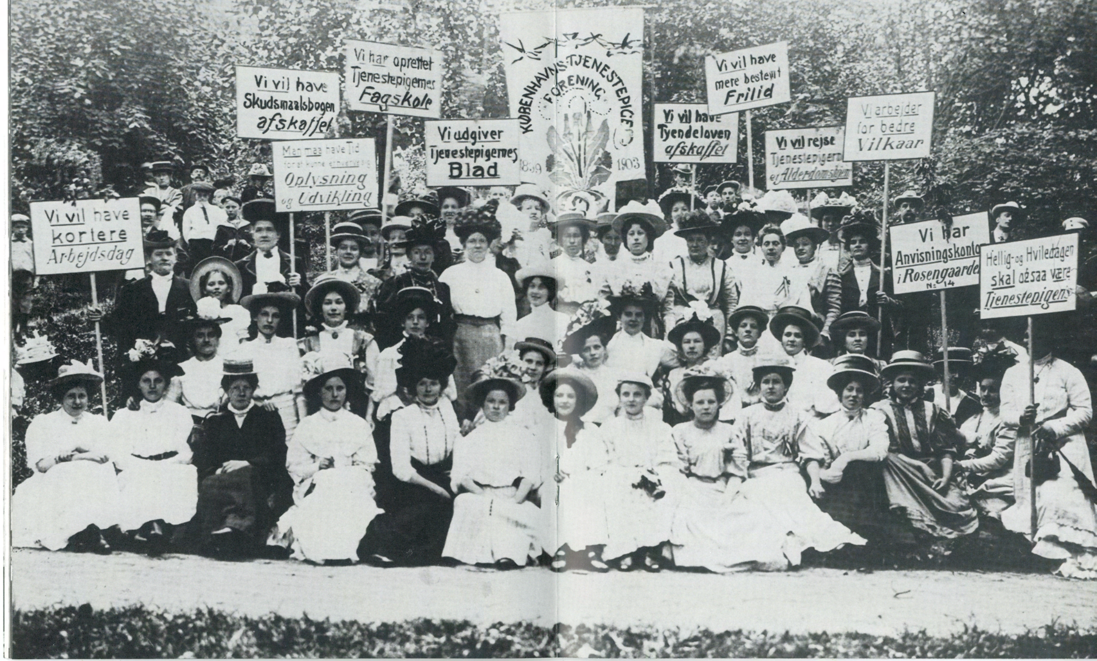
Tjenestepigeforeningens møde i Søndermarken 1907.