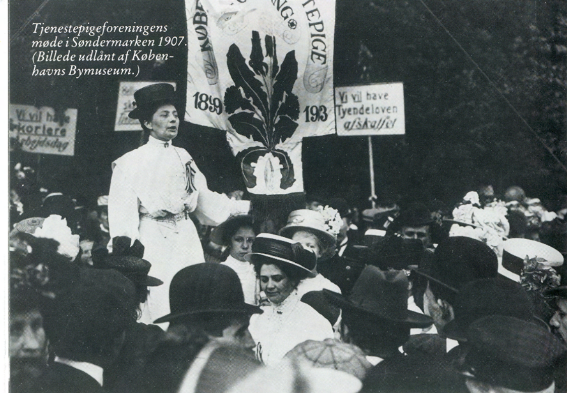
Tjenestepigeforeningens møde i Søndermarken 1907.