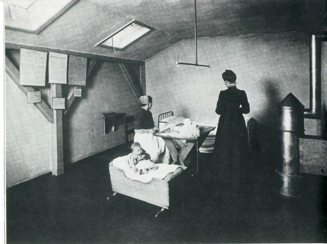
Loftscelle i Kvindefængslet på Christianshavns Torv, 1909.

Svangrskabsforebyggende midler og adgang til »fri« abort har naturligvis bevirket, at disse forbrydelser forekommer yderst sjældent i vore dage. Men de forekommer.