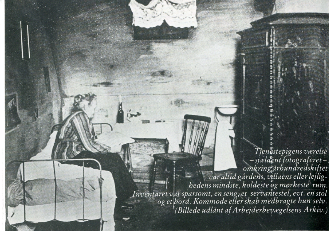
Tjenestepigens værelse – sjældent fotograferet – omkring århundredskiftet var altid gårdens, villaens eller lejlighedens mindste, koldeste og mørkeste rum. Inventaret var sparsomt, en seng, et servanestel, evt. en stol og et bord. Kommode eller skab medbragte hun selv.