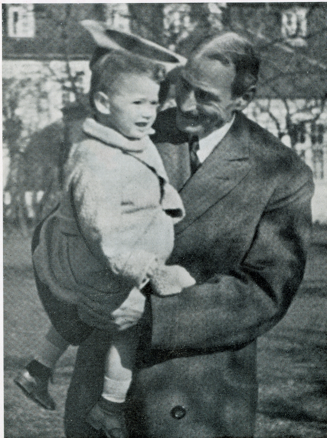
Kong Christian den X som Bedstefader.