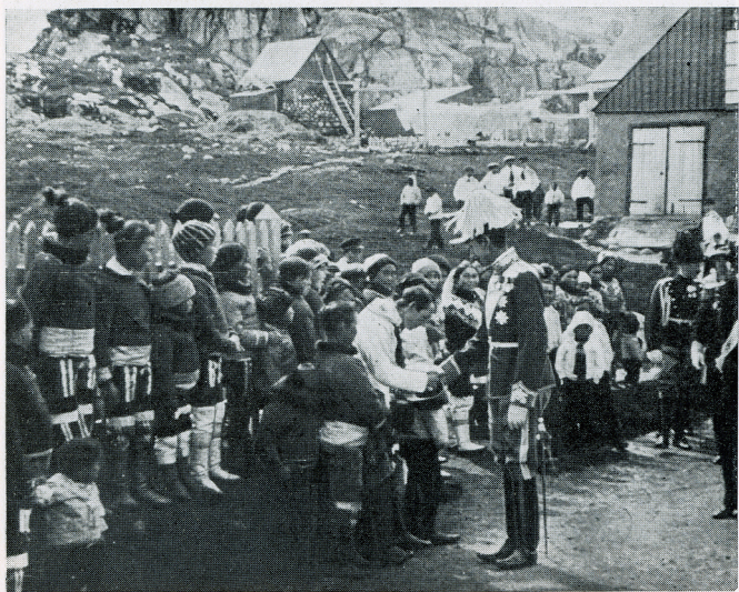
Juli 1921: Fra Kongens Besøg paa Grønland.