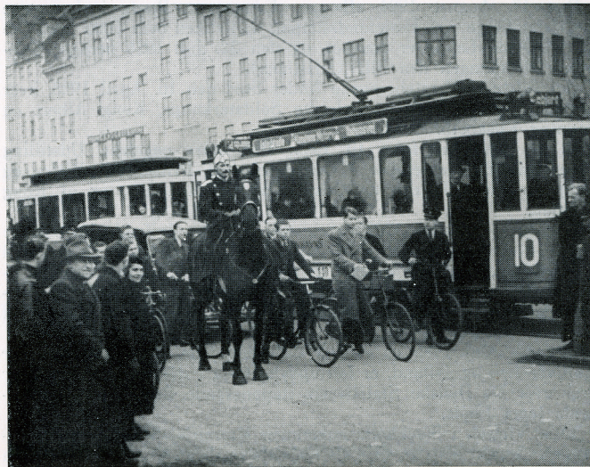
1937: Kongen paa sit Morgenridt gennem den travle Hovedstad.

Under Opholdet ved Grønlands Kyster kommer der pludselig Meddelelse om, at det svenske Skib „Bele“ er gaet paa Grund ved