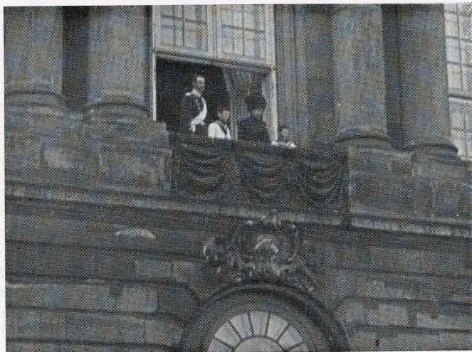
Amalienborg, den 15. Maj 1912.

MEDE en fejende og festlig March er Vagtparaden paa Vej gennem den travle Hovedstads Gader til Kongens Slot — og vi følger Trit med Kongens Soldater. Alle gaar vi med til Amalienborg, hvor Danmarks Historie er blevet skrevet, og hvorfra vi nu skal genopleve Kong Christian den X' 25 Regeringsaar.