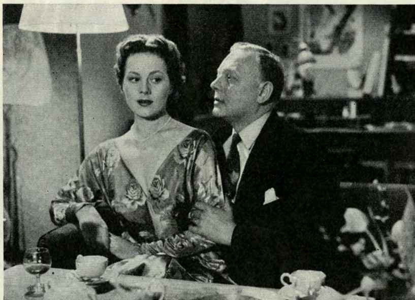
— Det er den bitre sandhed om livet, at det forbudte er det smukke — det dejlige — og det rigtige.