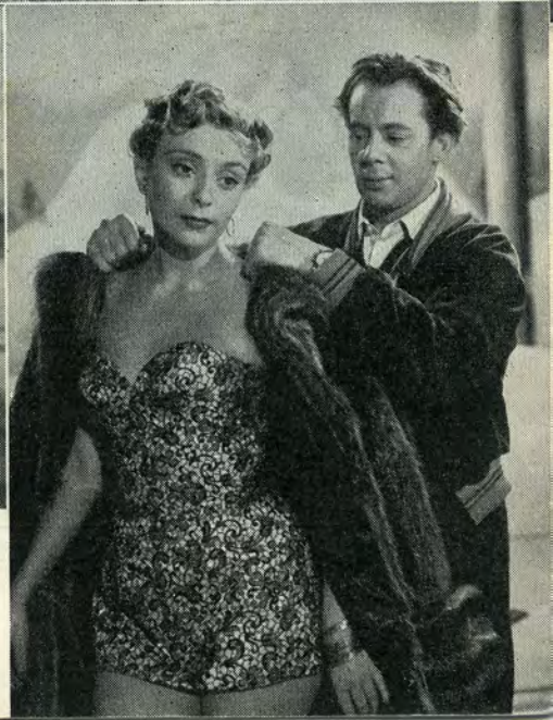
Astrid Villaume, Gunnar Lauring, Sigrid Horne-Rasmussen, Lis Löwert, Ove Sprogøe, Helge Kjørulf-Schmidt, Poul Reichhardt, Helle Virkner og Louis Miehe-Renard i forskellige situationer fra filmen.