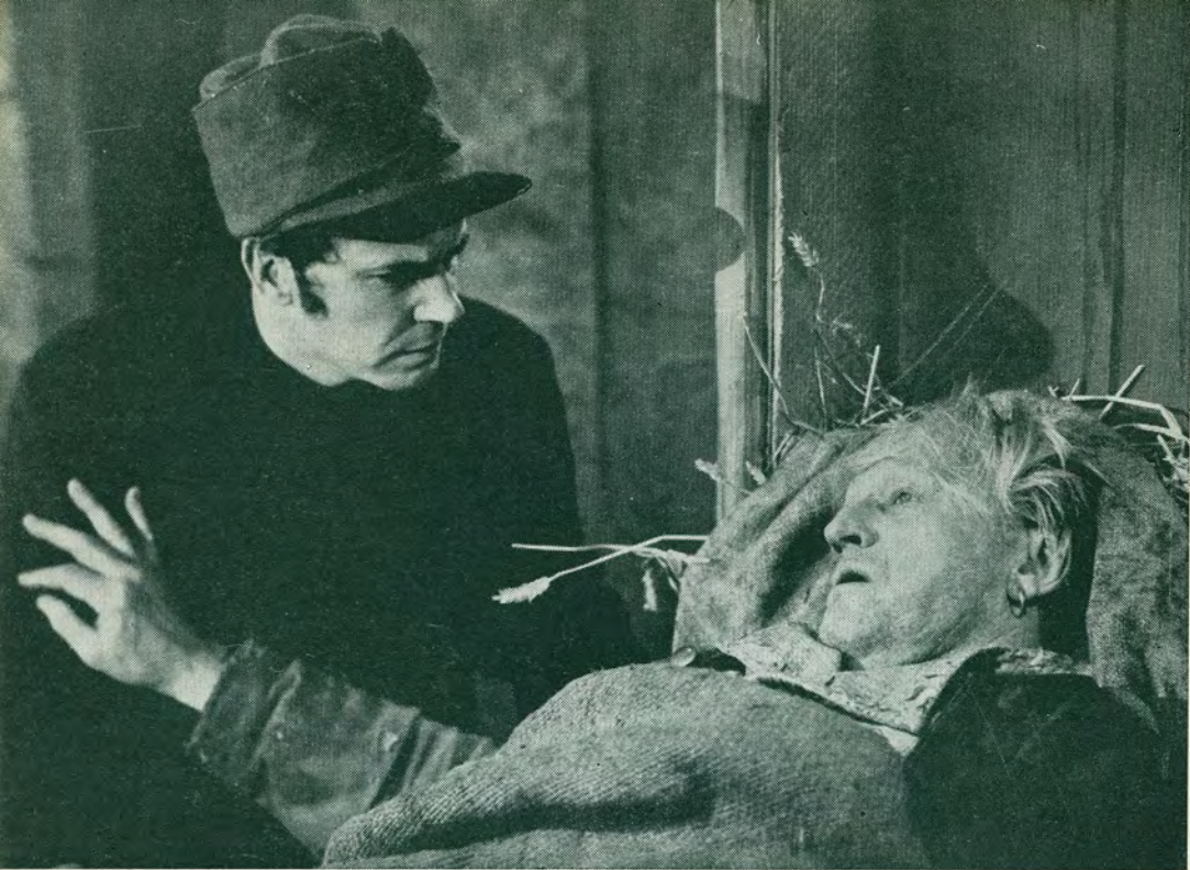
Rasmus Nielsen (Ebbe Rode) ved morfaderens Niels Nielsens dødsleje (Johannes Meyer).

end nogen anden åbnede folkets øjne for enevældens utilstrækkelighed. Landet har oplevet en række hårde år efter napoleonskrigene og Danmarks og Norges adskillelse i 1814. Statens fallit havde sat sig dybe spor. Landbruget hæmmedes af en alvorlig krise. Det enevældige styre hindrede fremskridt og udvikling, og forkæmperne for et friere samfundsliv straffedes hårdt.