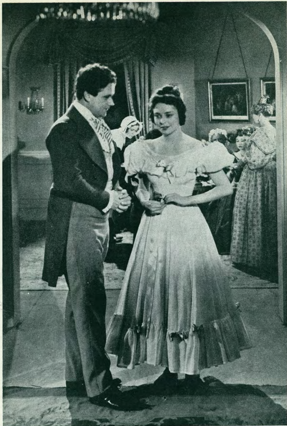
Orla Lehmann, den utrættelige forkæmper for en fri forfatning (Mogens Wieth), og Hans Puggaards datter Maria (Helle Virkner).