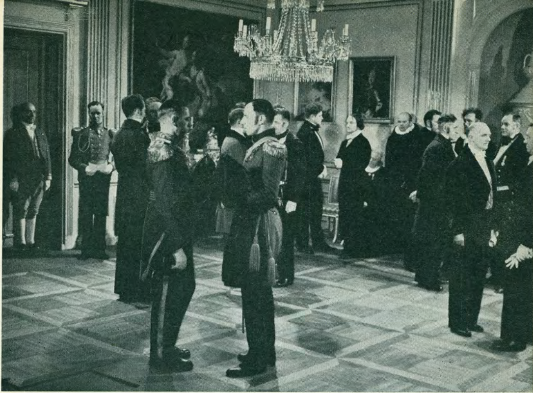
De nationalliberale politikere venter i forgemakket på audiens hos Christian VIII.