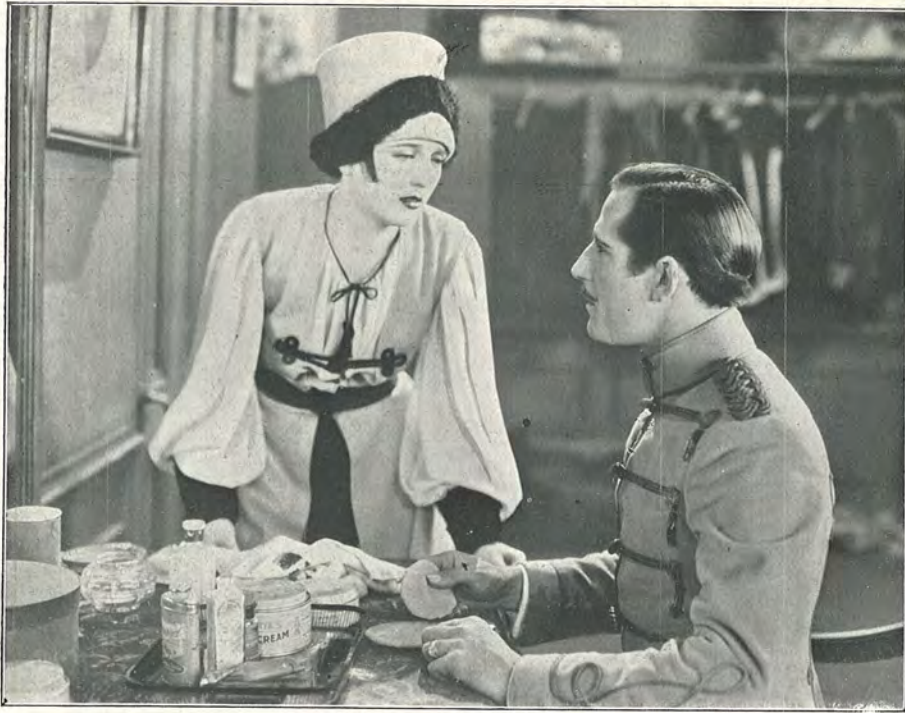
„Du er altid efter det Pigebarn!“

at han er en Forbryder, og Carl begynder forøvrigt selv at nære Afsky for det Liv, han lever.