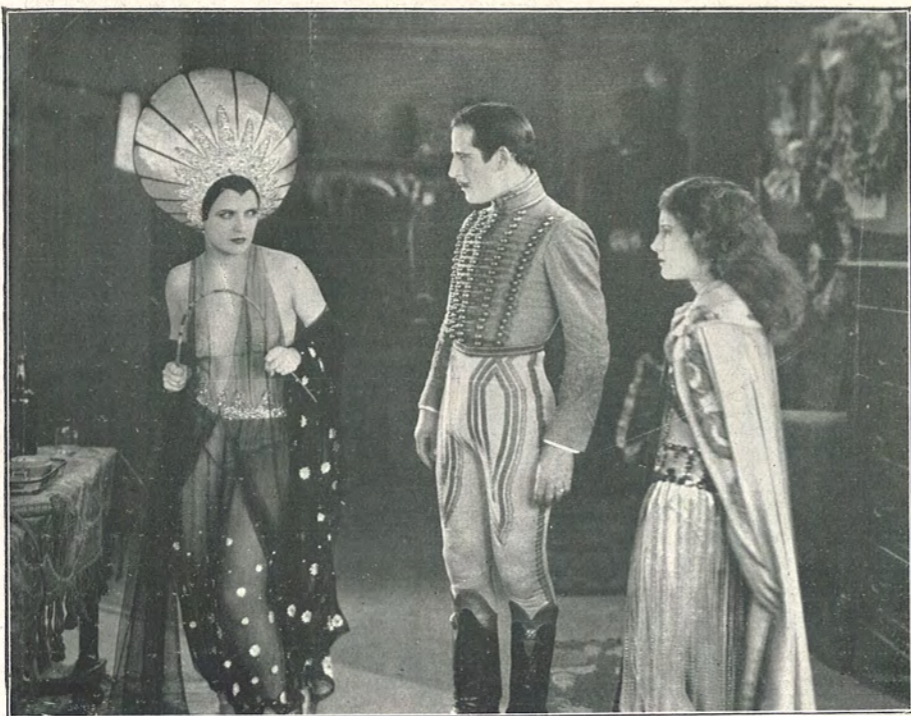
„Din lille Hyklerske! Jeg skal nok faa Ram paa dig!“