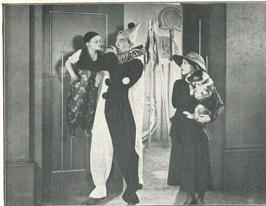
Karl Dane som Klounen

En Aften træffer han Mary. Hun er en forældreløs Pige, der lige er ankommet til den store By for at søge Engagement som Statistinde i en Cirkus. Men hun er kommet for sent til at faa Direktøren i Tale, og ukendt, som hun er, spørger hun den Mand, hun tilfældigt møder, hvor hun skal finde et Hotel. Carl anviser hende et Sted, men alt er optaget. Saa foreslaar han hende, at hun kan gaa med ham, og den godtroende Mary følger ham uden Betænkning.