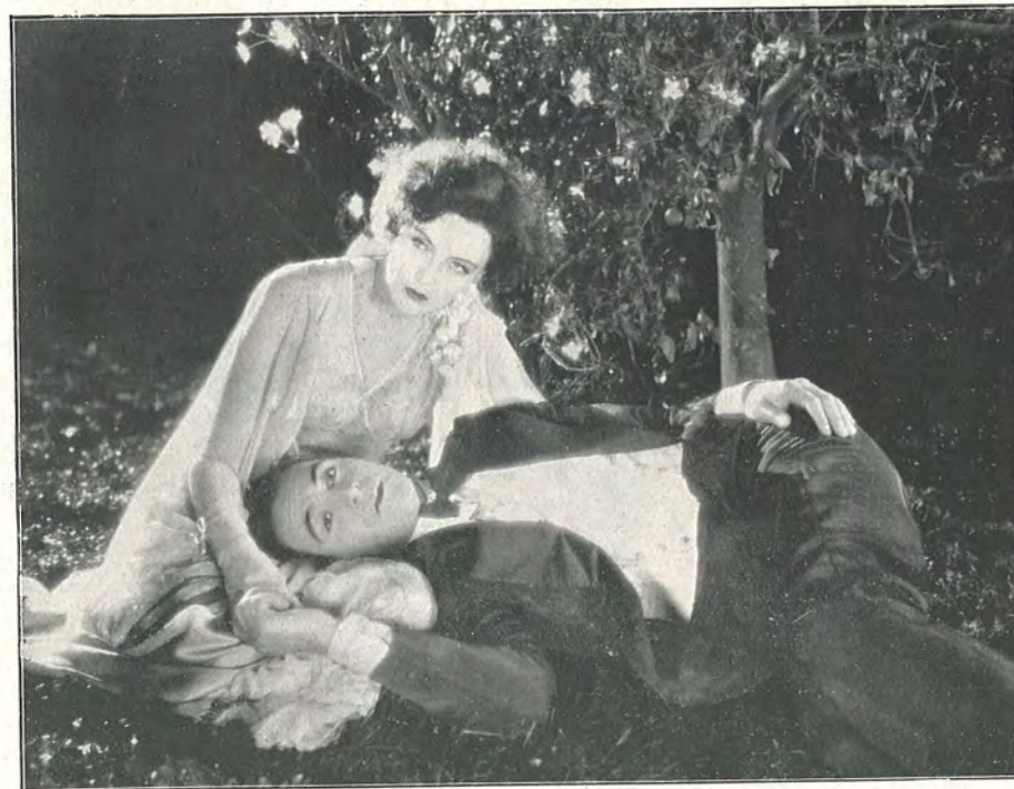
Greta Garbo og Ricardo Cortez i en Blasco Ibanez-Film.

Blasco Ibanez, Fred Niblo og Greta Garbo — det er tre berømte Navne, og med Rette vil Publikum stille store Forventninger til en Film, som fremføres af denne Trio — men vi tør garantere for, at »Fristerinden« vil overstraale selv de største Forventninger.