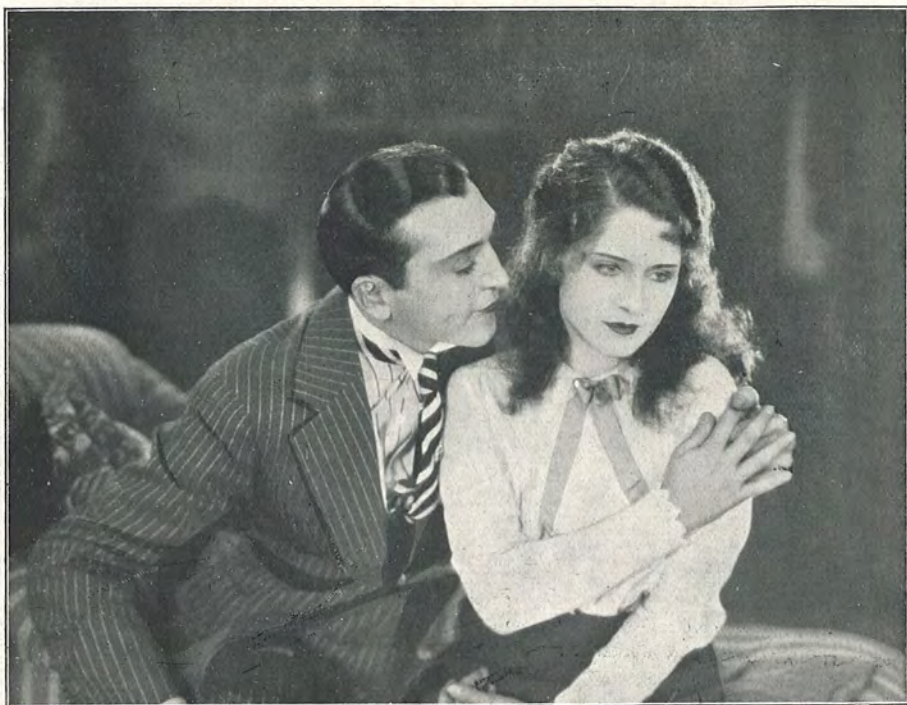
„Vil De virkelig bilde mig ind, at De aldrig har kysset en Mand før?“