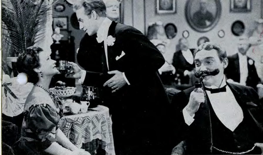
Claes charmerer Elise —

Heldigvis får søløjtnanten, som har fattet en stærk interesse for automobiler, en ny chance, og ved nytårsfesten hos Friis, hvor stemningen i begyndelsen er trykket, sker der en lykkelig vending. Champagn knalder, og det ser ud til, at århundredskiftet vil bringe fred og forsoning til alle i den kære familie.