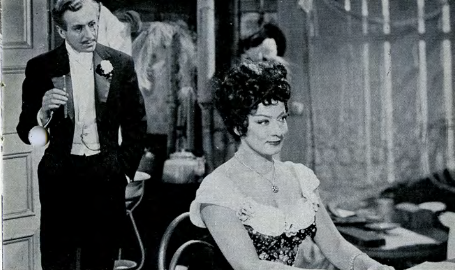
Grev Maagenhjelm besøger Julie i garderoben.

Troligen är jag ett vanskeligt fall. Det som jag vill är ej det som jag skall. Jag har för lätt för att bli kär. Hjälp mig, vad gör man åt sånt där?