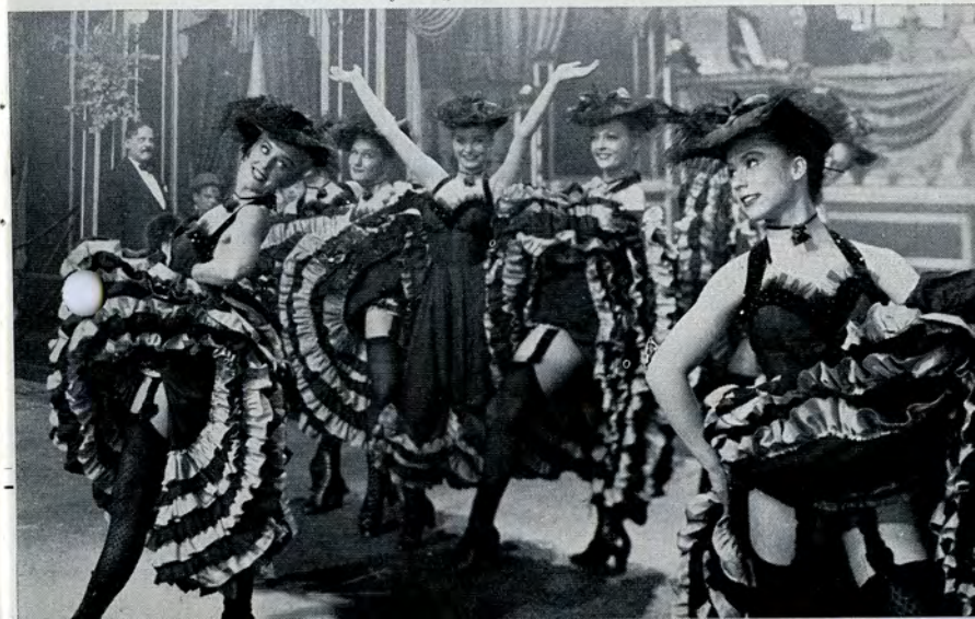
Datidens forargelige dans — can-can.