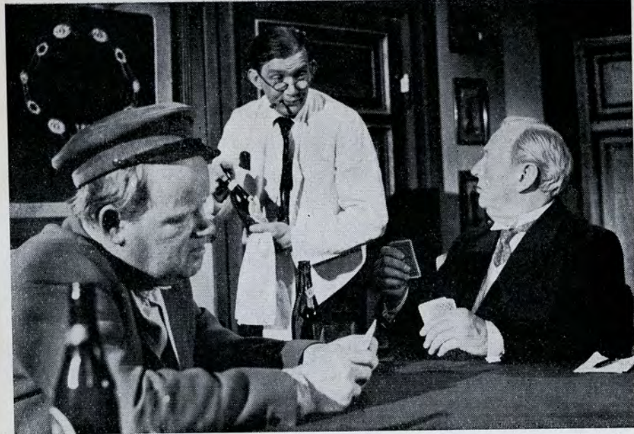
»Pastor Fromm vil tale med borgmesteren«