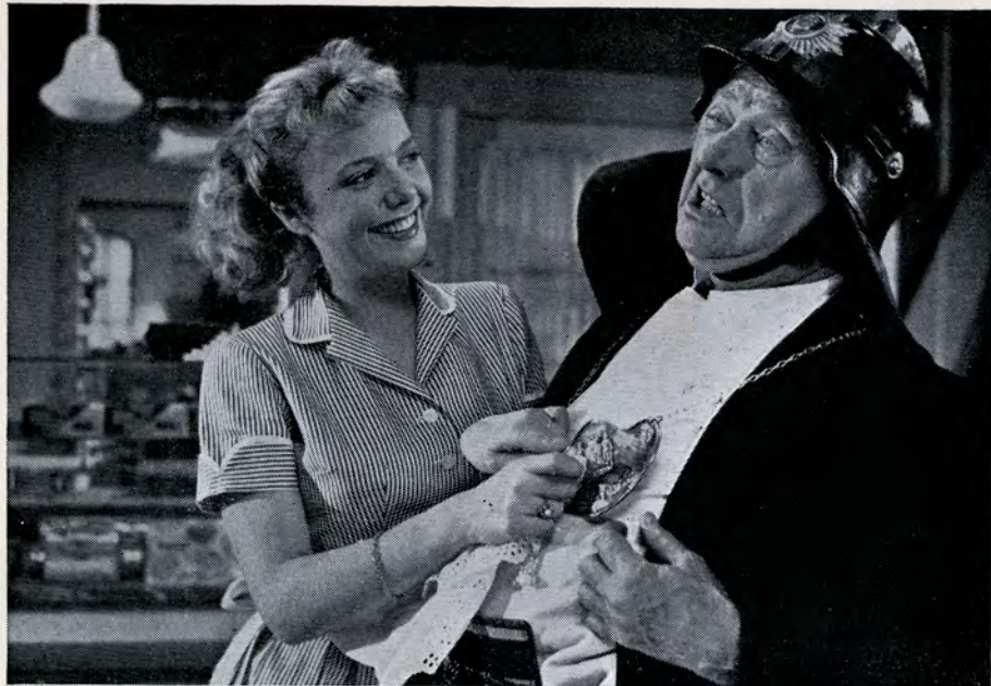
»Skynd dig, min pige, det brænder jo ned«