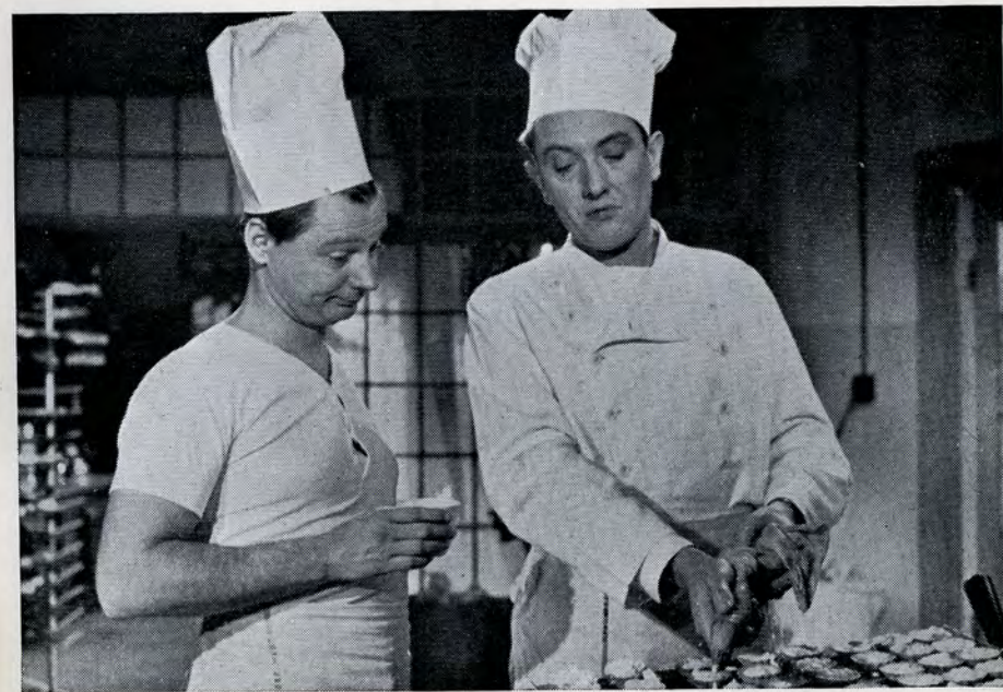
»Du bli'r aldrig konditor!« »Vil du love mig det?«