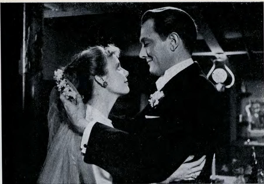
»Jeg lover dig, du får ikke brug for dit brudeslør mere«