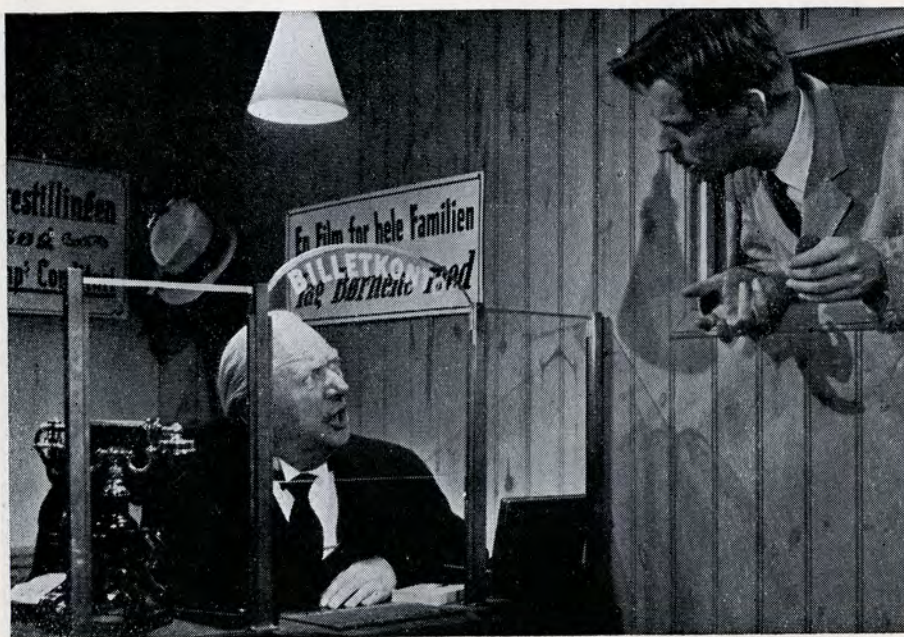
»Der er ingen lyd på filmstrimlen, mester«