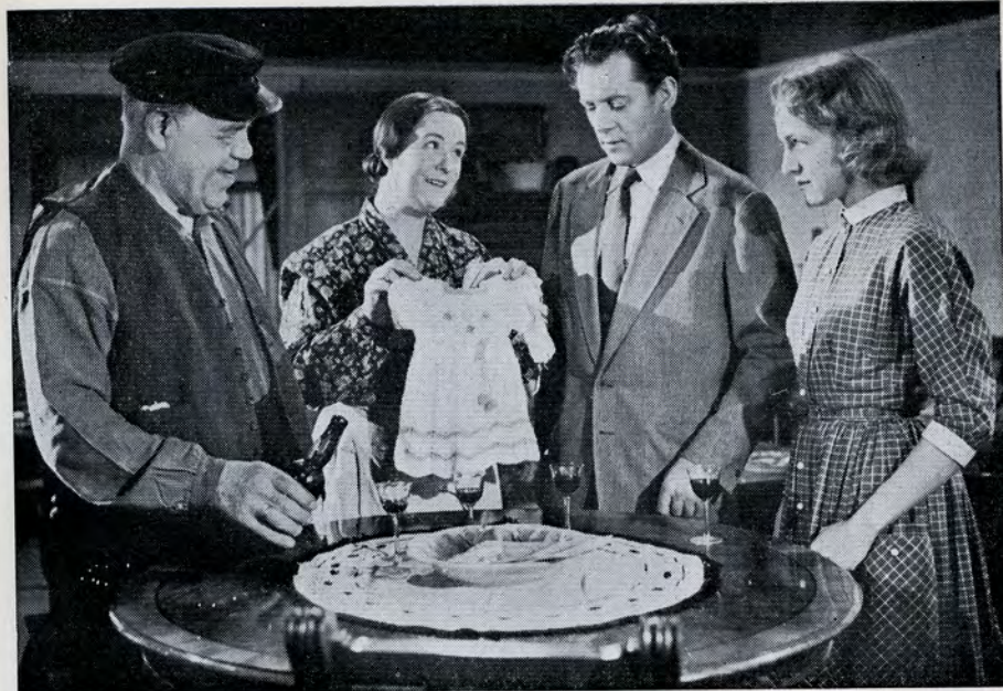
»— — det er hendes egen dåbskjøle«