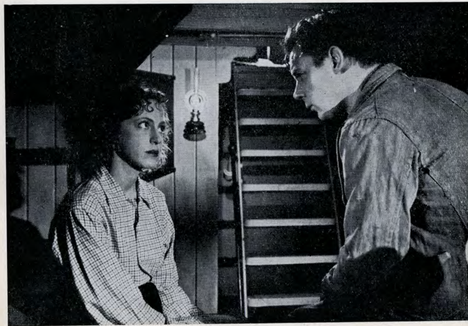
»Ved Deres forældre det?« »Nej«