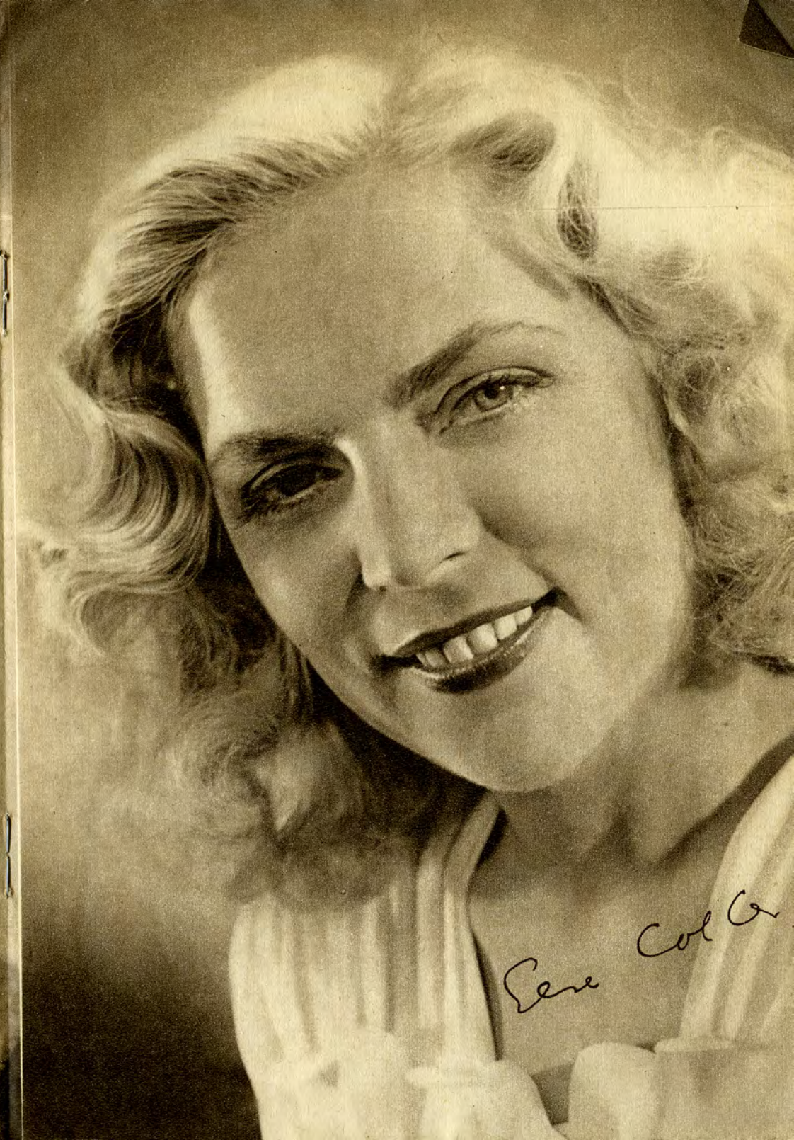
Eene Col G