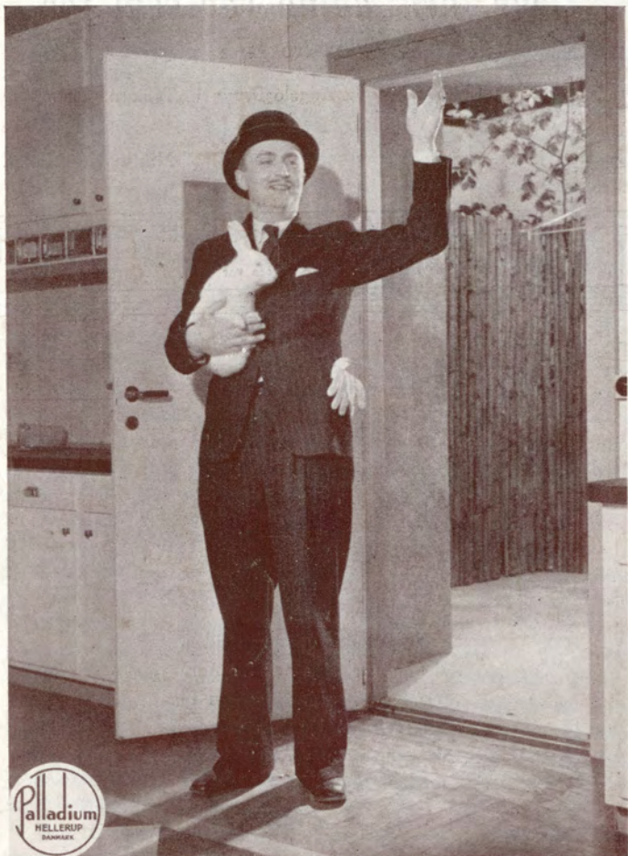
Programmet — Redigeret af Ole Palsbo A/S L. Ihrich's Bogtr.