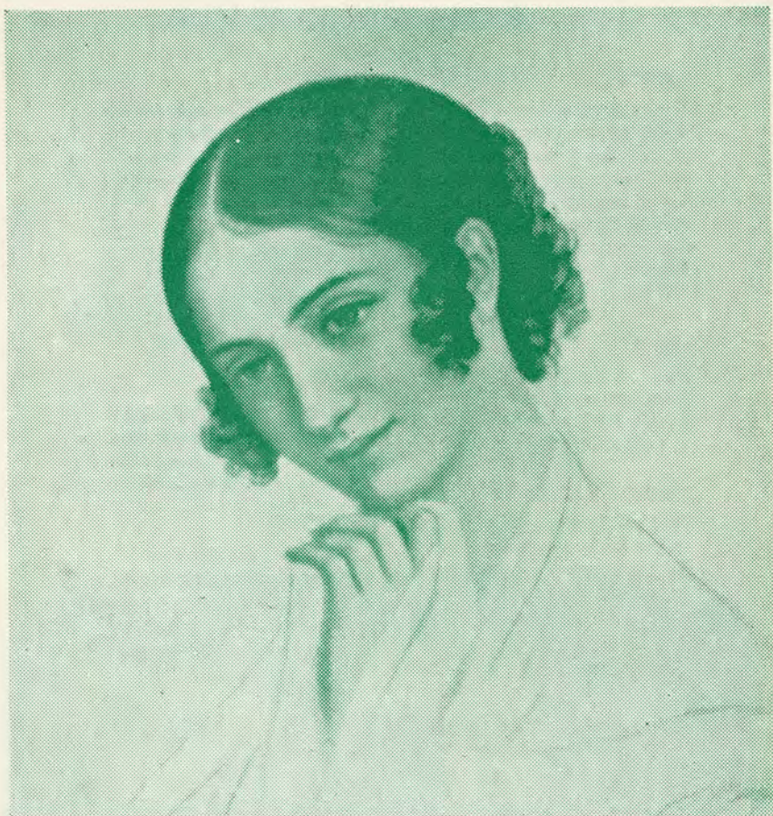
Efter tegning af departementschef Weiss, sen., Teatermuseet, Christiansborg