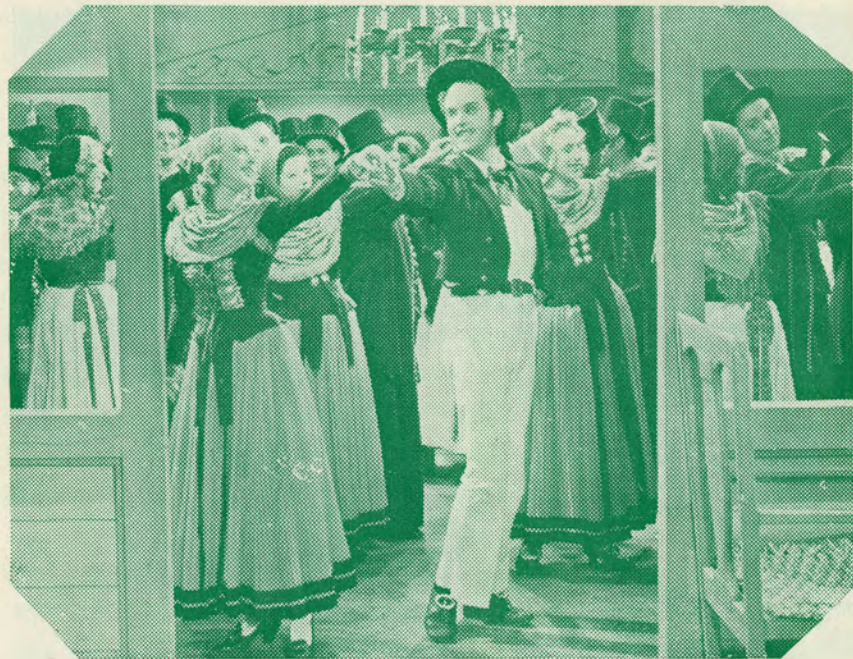
Dansen på kroen

Han ser på mig med øjne blå, to store tårer i dem stå; da tro vi os i himlen hos Guds engle små.