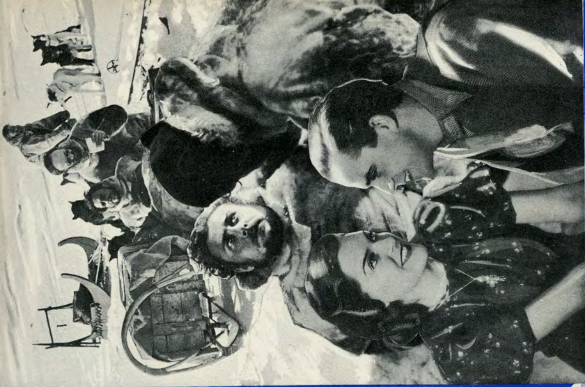
S. L. MOLLERS BOGTR. KBHV.N.

Derved udryddede han den eneste Hindring for Sigurd til at drage hjem til Aino og den lille Søn, hun havde født ham under hans lange Fravær, og hjem til Faderen, der ikke alene var villig til helt at tilgive Sønnen, men som længtes efter at optage ham, Aino og den lille Sonneson i sit Hjem.