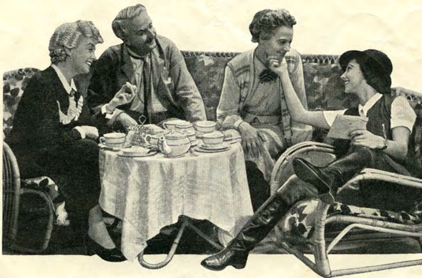
Familien drofter Indbydelsen til Garden-party paa Gertrudsdal.

Kort efter lægger Færgen til, og Komtesse kører bort i sin flotte amerikanske Bil uden at ane, at hun har lagt sig ud med den mægtige Bankdirektør Eskildsen , og hun aner lige saa lidt, at hun har vakt Grev Torben Hjelms uforbeholdne Beundring.