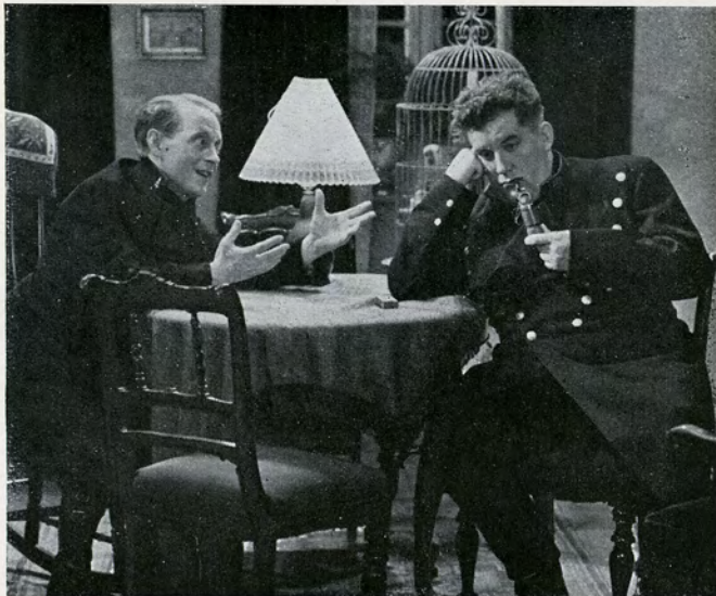
„Hvorfor hænger du med Hovedet? Du er dog Kvarterets populæreste Mand!“

et godt Kup, og Panser-Basse faar en stor Ducør, som han deler med sine Kammerater.