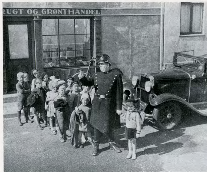
Panser-Basse er Børnenes Ven.

Panser-Basse bor sammen med sin Ven, der er Nattevagt, de har en hyggelig lille Ungkarlejlighed paa tredie Sal i et af Kvarterets gamle Huse. Deres Nabo er en ung Syerske, Eva, og hendes Broder Poul, en arbejdsløs Mekaniker, samt deres afdøde Søsters lille Pige, Connie . . . . Det staar smaat til i det lille Hjem, og en Aften springer den unge Mand i Havnen for at drukne sig, men Panser-Basse , der har en forbløffende Evne til at dukke op, hvor der sker noget, redder ham i sidste Øjeblik. Han holder en Formaningstale til den unge Fyr, fortæller ham, at hver Dag har sin Chance, og at „Alting er godt for noget“.