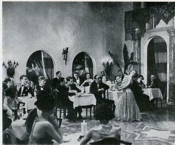
„Engelske Joe“ morer sig i en mexikansk Restaurant.

EN amerikansk Gangster med Tilnavnet „Engelske Joe“ er med sin Bande, der bestaar af fire Mand foruden ham selv, flygtet over den mexikanske Grænse. Det amerikanske Politi er efter dem paa Grund af et Bankrøveri, hvor de dræbte flere af Bankens Personale . . . . Men „Engelske Joe“ fatter snart en ny Plan, der kan bringe dem i Sikkerhed for en Tid og samtidig giver dem Lejlighed til et nyt Kup. En gammel Ingeniør, der har arbejdet paa en Vaabenfabrik i Mexico, er rejst hjem til sit eget Land for at fuldføre en epokegørende Opfindelse . . . . det lydløse Maskingevær!