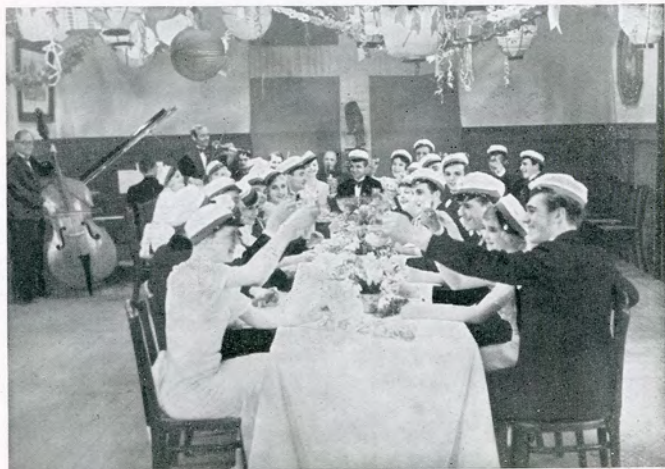
— Helan gaar!

Det er dog kun temmelig modvilligt, at Frost gaar med til at yde dette Laan, han synes ikke om, at Pigeboern skal studere, og han er bange for, at der skal opstaa Kæresteri mellem Grethe og Hans.