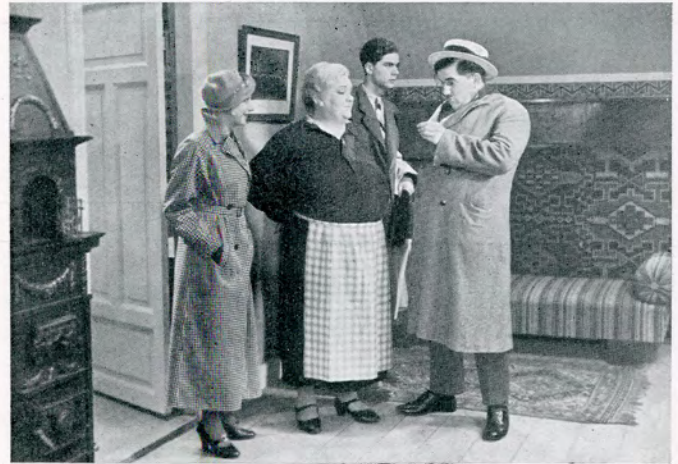
Maa je g ordne det kontant .. her er nemlig Klejner i Kagekassen!

Efter Ankomsten til København lærer han dem Byen at kende, og navnlig søger han at give dem et Indblik i Storbyens Fristelser, saa at de bedre kan tage sig i Agt. Onkel