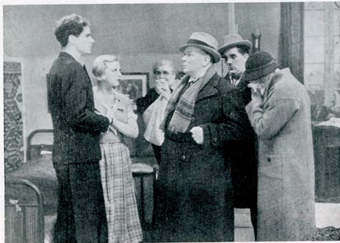
— Du har bedraget os, Hans. Du studerer ikke mere!

Gennem Modgangen lærer den unge Mand at staa paa egne Ben. Han faar Engagement som Musiker paa en lille Restaurant og kan i hvert Fald tjene tilstrækkeligt til Livets