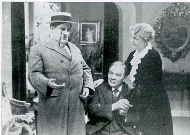
I dette Øjeblik finder Immatrikulationen Sted.

kun er de dygtigste, der naar frem, og den unge Mand ved godt, at det er smaat bevendt med hans Lyst til Studierne. I den kommende Tid forsømmer han helt sin Læsning og beskæftiger sig væsentlig kun med Musik.