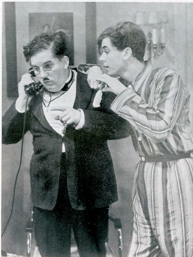
— Ja, det er en skrækkelig Tilværelse ....

Hos Købmanden fejres den lykkeligt overstaaede Studentereksamen med stort Selskab. Alle Byens Honoratiorens med selve Borgmesteren i Spidsen er indbudt, og Frost holder en dybtfølt Tale for Sønnen og udtaler Ønsket om, at han maa naa frem til en stor Stilling. Hans keder sig frygteligt og vilde meget hellere have været sammen med Kammeraterne,