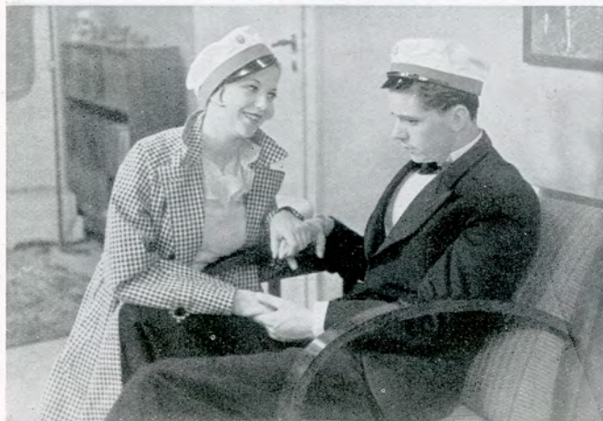
— Vil du være professionel Musiker, Hans?

Hans og Grethe er lykkelige, indtil Sandheden gaar op for dem . . . . hun skal have et Barn. De ved ikke, hvad de