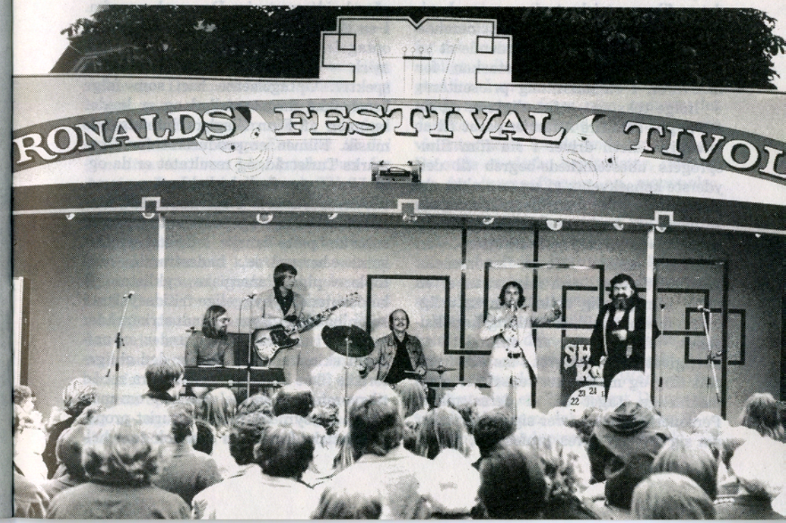
Danmark A + B

Fælles for PHs, Brydesen-Rifbjerg-Ørstedes og Refns Danmarksfilm er, at de nok er kunstnerisk ambitiøse og personlige Danmarksbilleder, men samtidig bekender sig til turistfilmens og den oplysende films traditioner. Alle tre giver et i bogstavelig forstand overfladisk billede af Danmark. Danmark er i filme-