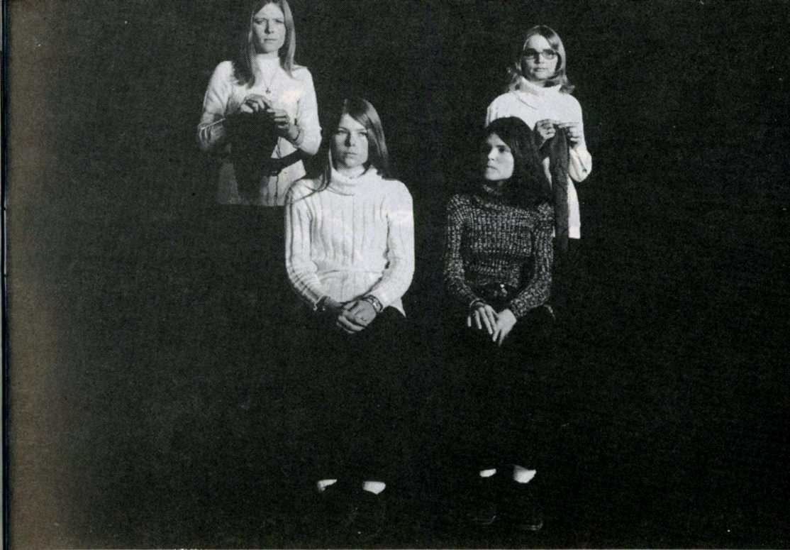
Livet i Danmark

I 1974 kom Ole Askman med kortfilmen Danmark 1974 , et helt konventionelt bidrag til genren. Dens gennemgående idé er at vise Danmark oppefra. I en elegant montage af fine helikopter optagelser og crane-shots vises Danmark — sommeren 1974 — i fugleperspektiv. Optagelserne har, som følge heraf, ikke meget reallyd og er kædet sammen af Finn Zieglers intetsigende musik. Filmen er produceret for Danmarks Turistråd, og resultatet er da også blevet overfladisk, lækkert og næsten demonstrativt u-kontroversielt. Der er lutter venlige og pæne optagelser af smukke, pære-danske landskaber, fine gamle herregårde, badestrande med topløse piger, energiske cyklister på landevejene og hyggelige fritidssyslere i kolonihaverne. Byer og industriområder anskues i malerisk højde under en uafbrudt skinnende sol. Der er den obligatoriske fikse klipning — f.eks. fra robåd til svømmende and — men selv om man tager hensyn til filmens turist-propagandistiske formål, er den nok som hel-