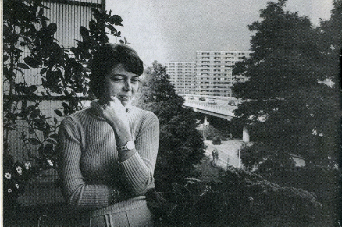
Damen på altanen i »Danmark A + B«.

ad Rubjerg Knude, og til de evindelige cyklister, som helt tager overhånd i filmens finale, hvor man ser en hær af overtonede cyklende på baggrund af skiftende optagelser af Københavns tårne; overtoningsteknikken får det til at tage sig ud som om byen er befolket med spøgelsesagtige, metafysiske cyklister. Det er en af filmens få kunstige effekter, og en af de få ting, som anmelderne bifaldt. »Alting er flydende! / Lev livet glidende! / Byen er som et svinghjul / Du er selv det glidende kamera!« hedder det i den afsluttende cykelsang (for dem der ellers kan opfatte ordene). Filmens glidende travellings var dog ikke optaget fra cykel, men fra en DKW, model 1931, som var afbildet i programmets reklame. Cykelsangen sammenfatter filmens æstetik og tematik: tilværelsen — især livet i Danmark — er en glidende bevægelse gennem landskaber, som kun kan indfanges af