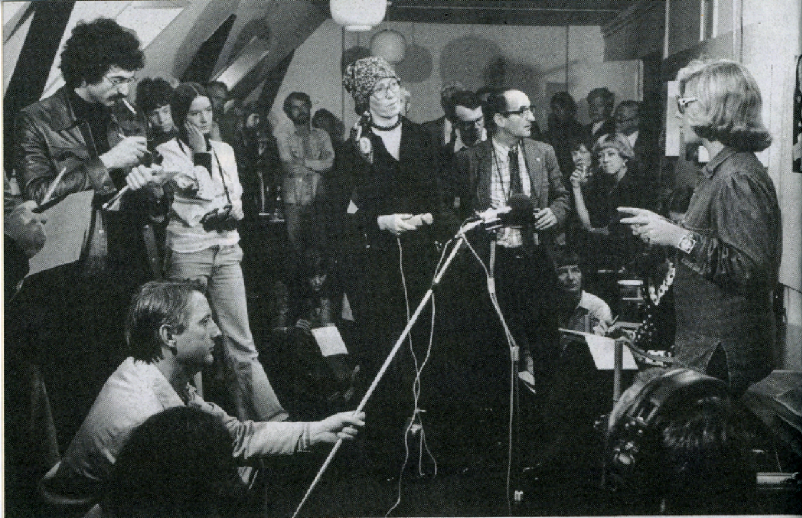
Danmark A + B

(sendt 24/9 1975). Danmarks Radios officielle karakteristik af filmen lød: »På baggrund af det statistiske materiale, der foreligger om selvmord og selvmordsforsøg i Danmark, prøver den engelske filmskaber Peter Watkins at give et billede af »Halvfjerdsernes folk«. Hans fremstillingsform er en blanding af spillede scener, dokumentaroptagelser og interviews«. Ligesom hans nye biograf-distribuerede spillefilm, den ikke semi- men pseudo-dokumentariske Aftenlandet (premiere 21/2 1977) om konflikterne i morgen?-dagens Danmark, kan 70'ernes folk betragtes som en slags karikeret Danmarks-film, halvvejs tilhørende horror- og science fiction genren.