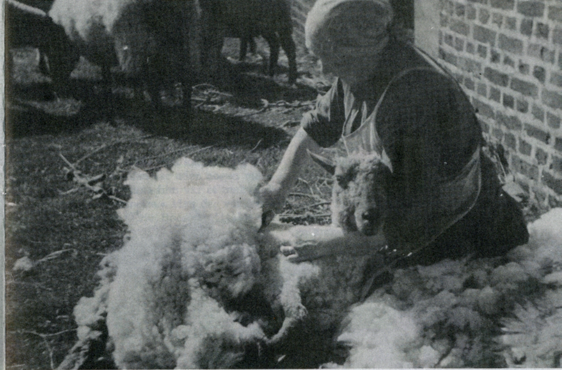
Danmark — PH 1935

under filmen.« Filmen fik endelig — stadig i den nedklippede version — offentlig Københavns-premiere i Kinografen den 16. december.