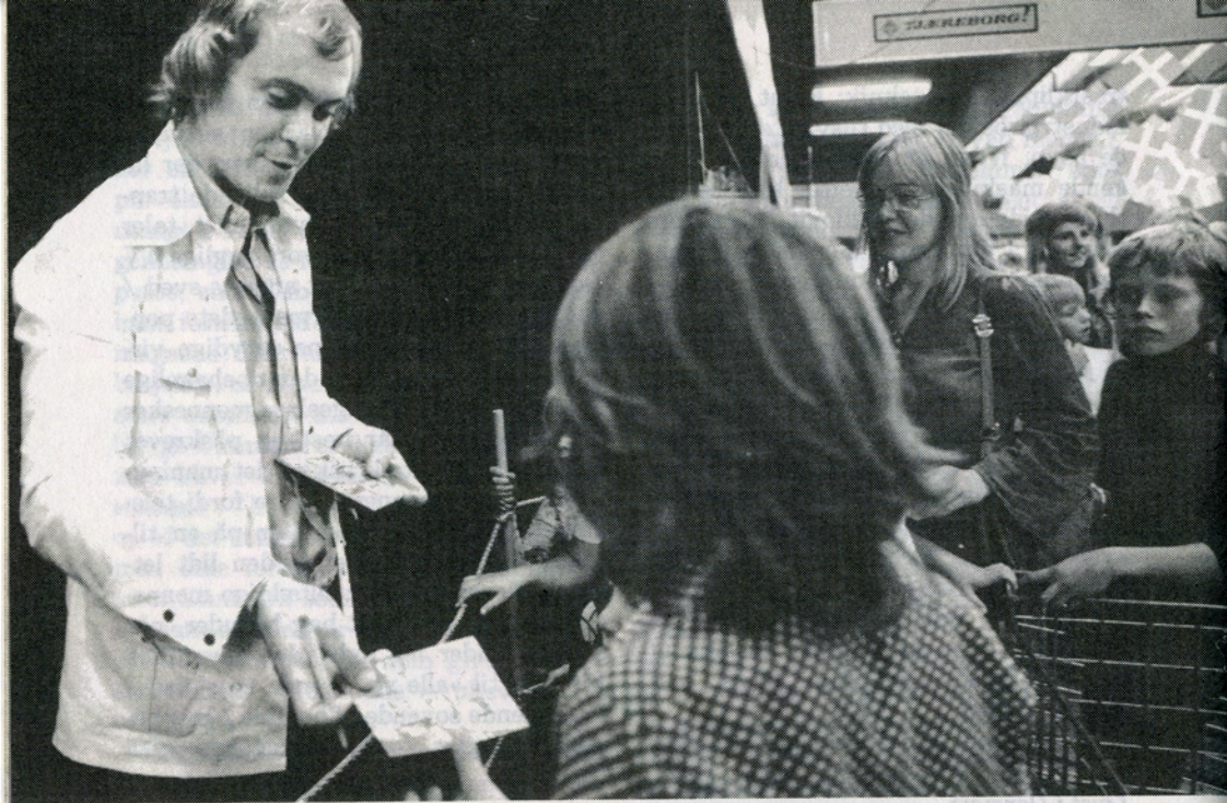
Danmark A + B

uden tanke / på at knuses / men med bevidstheden / om noget andet / en anden lykke«. Digtets kvalitet ufortalt, virker det sammenkoblet med billederne anstrengt pretentiøst. Filmen blev ved sin fremkomst både kritiseret og rost for sin skildring af negative sider af fædrelandet. Dristigt blev det vist, at der var berusede personer i Danmark, ja mere end 50 pct. af de personer, som fik lejlighed til at udtrykke sig i filmen, var tilsyneladende under indflydelse af berusede drikke. Opmærksomme tilskuere kunne notere sig, at én af de berusede personer, som i filmen råbte ukvemsord efter to medlemmer af ordenspolitiet, stod på hjørnet af Dronningensgade og Store Søndervoldstræde og sås på baggrund af en velkendt hvidkalket bygning — man husker det som en af filmens dristigste påvisninger af kontrastforhold i det danske samfund.