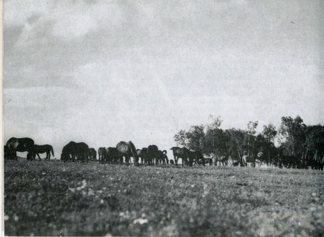
Danmark — PH 1935

stemmelse mellem billede og tone,« men mente, at det var »i sig selv fuldkommen urimeligt at lave en film, som over for den fremmede skal karakterisere det særpræget nationale i sine billeder, og så lade den ledsage af musik, der af instruktøren selv på forhånd er karakteriseret som international jazz-musik »; »Trafic« mente nok, at der »på forhånd syntes at være nogen mening i at ledsage filmen med jazzmusik i stedet for danske melodier. Men forudsætningen måtte være, at det var en levende, festlig, humørfyldt musik«, og dette her var tværtimod en »flad, kedelig jazzmusik med en søvndyssende rytme, indsunget med uforståelige ord af et københavnsk børnekor.« »Ekstrabladet« skrev, at »filmens største misforståelse var dens musik. Mens jazzrytmen står godt til