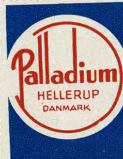
Palladiums Billedserie Nr. 104