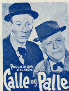
Palladiums Billedserie Nr. 101