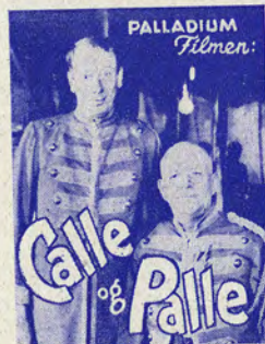
Palladiums Billedserie Nr. 103