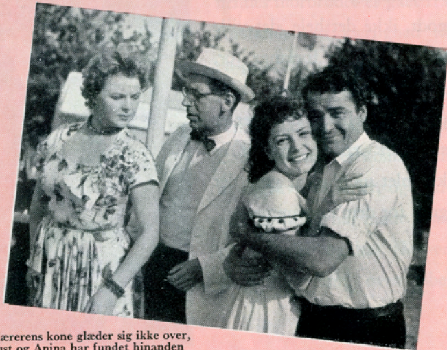
Skolelærerens kone glæder sig ikke over, at Laust og Anina har fundet hinanden ved gymnastikfesten (Bodil Steen, Poul Müller, Lilliane Maes og Carl Ottosen)