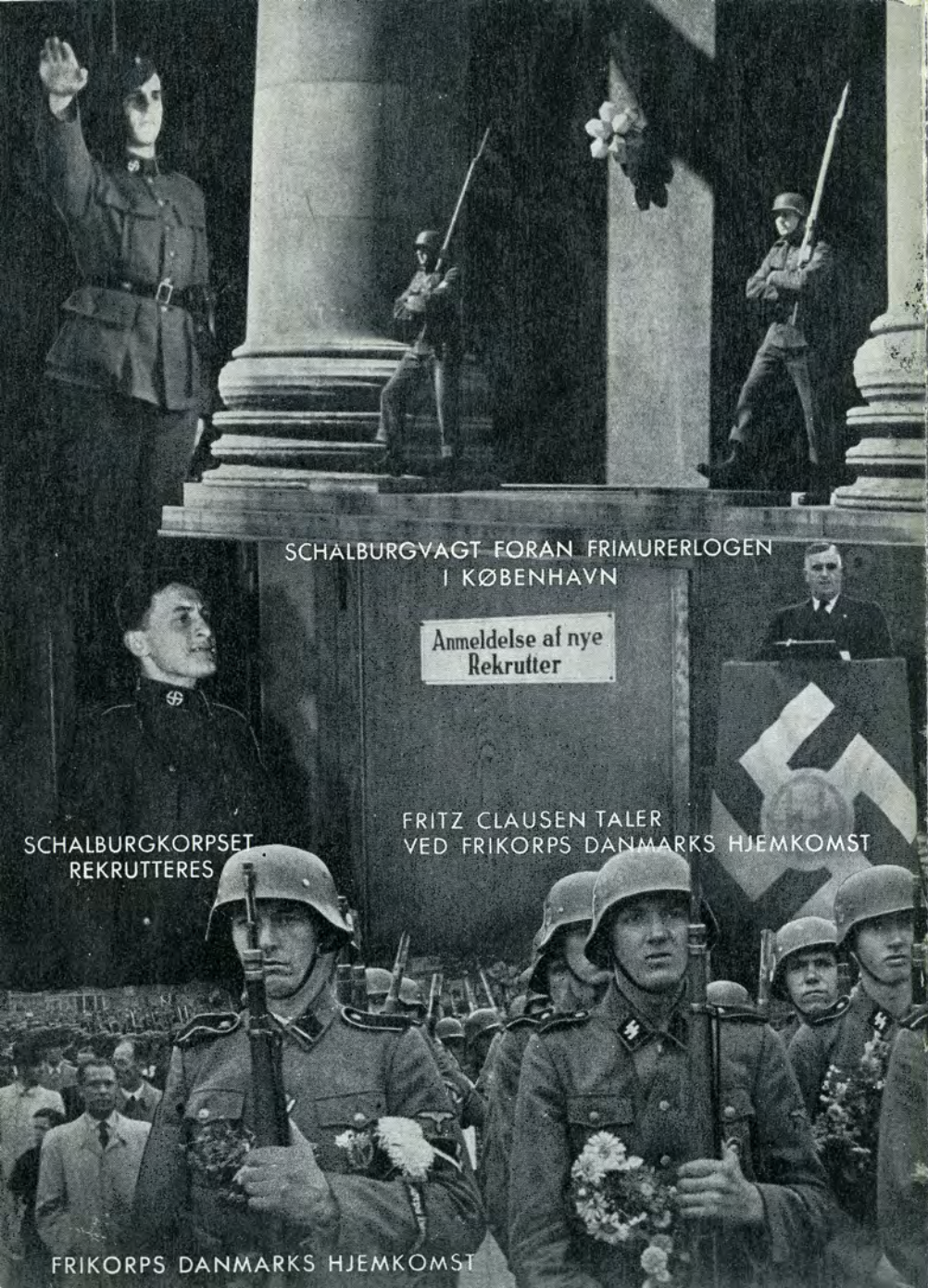
SCHALBURGVAGT FORAN FRIMURERLOGEN I KØBENHAVN