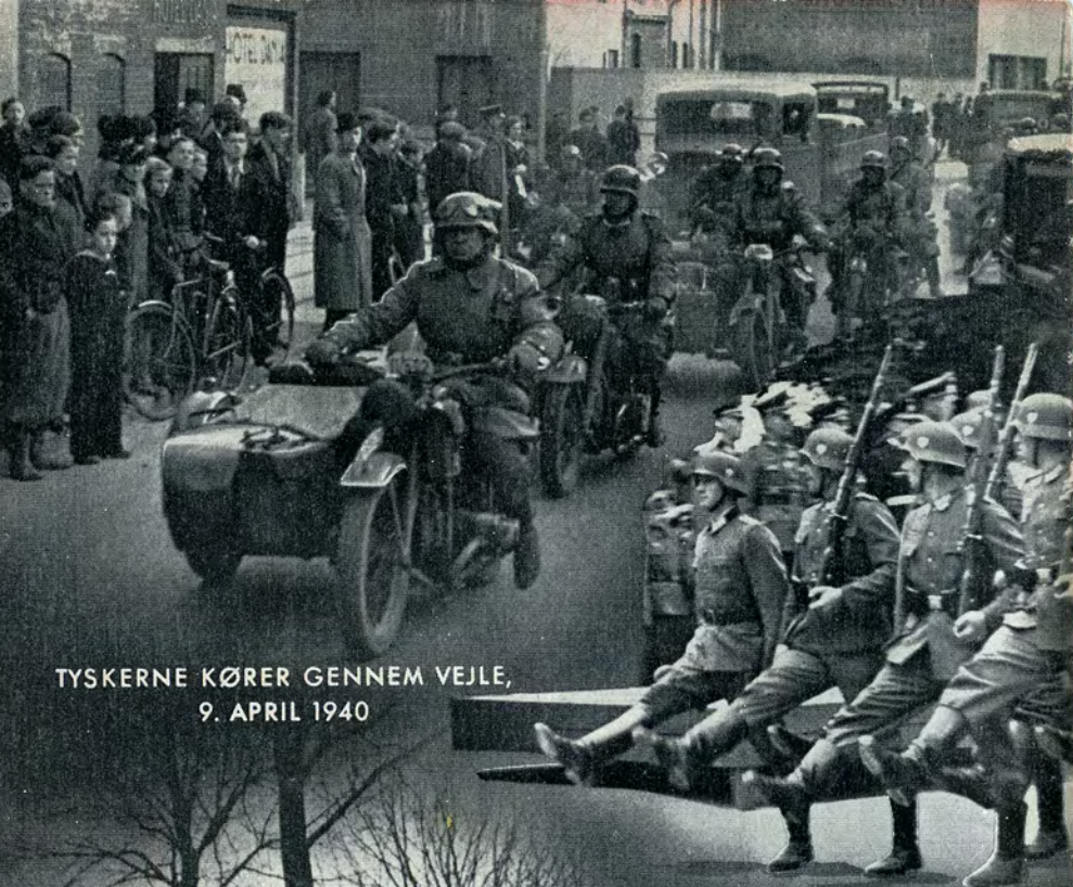
TYSKERNE KØRER GENNEM VEJLE, 9. APRIL 1940