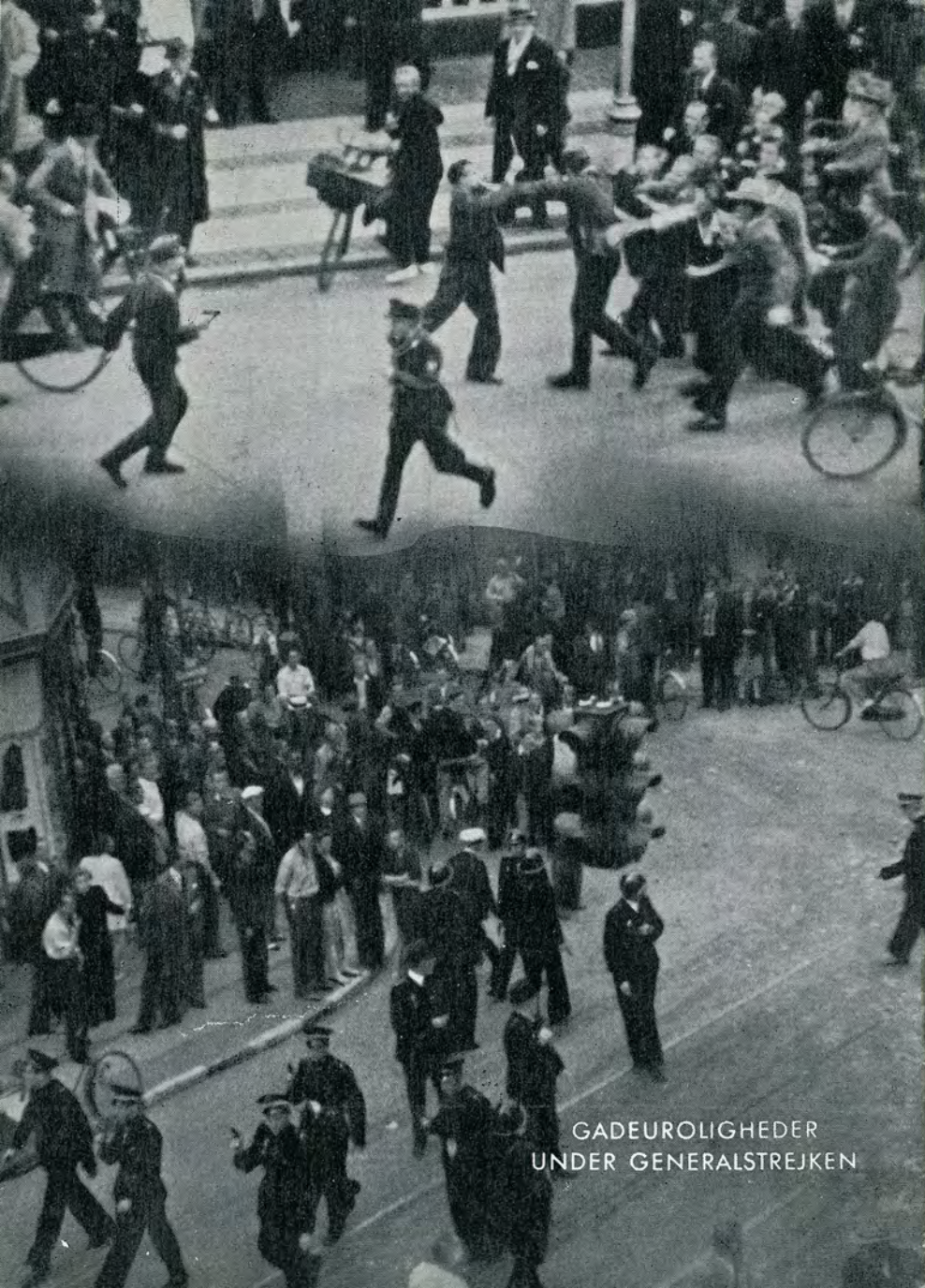
GADEUROLIGHEDER UNDER GENERALSTREJKEN