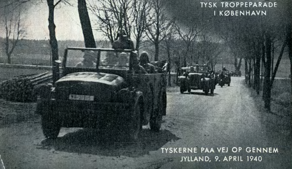
TYSKERNE PAA VEJ OP GENNEM JYLLAND, 9. APRIL 1940