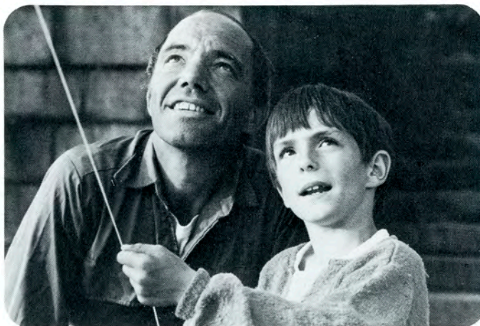
Jeg er en Gummi Tarzan ...

Filmen er produceret af Metronome Productions A/S, med støtte fra Det danske Filminstitut.