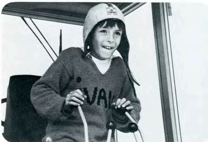
— og det er jeg ret glad for