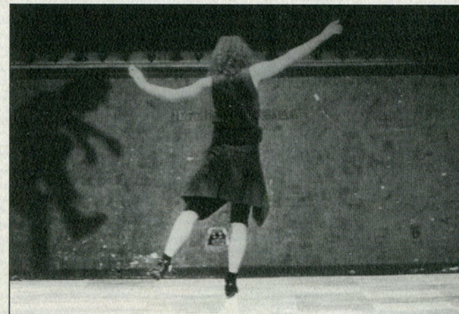
Parløb og spejlinger i spillet mellem danser og skygge i Roseland

Video Dans forfører... og den egentlige forfører er den bevægelse, som opstår i kraft af dansens intensitet og videoens elektroniske kommentarer til den. Når det lykkes at forføre os, dvs. når iscenesættelsen af kunstarterne i hinandens spejl fungerer optimalt, skyldes det