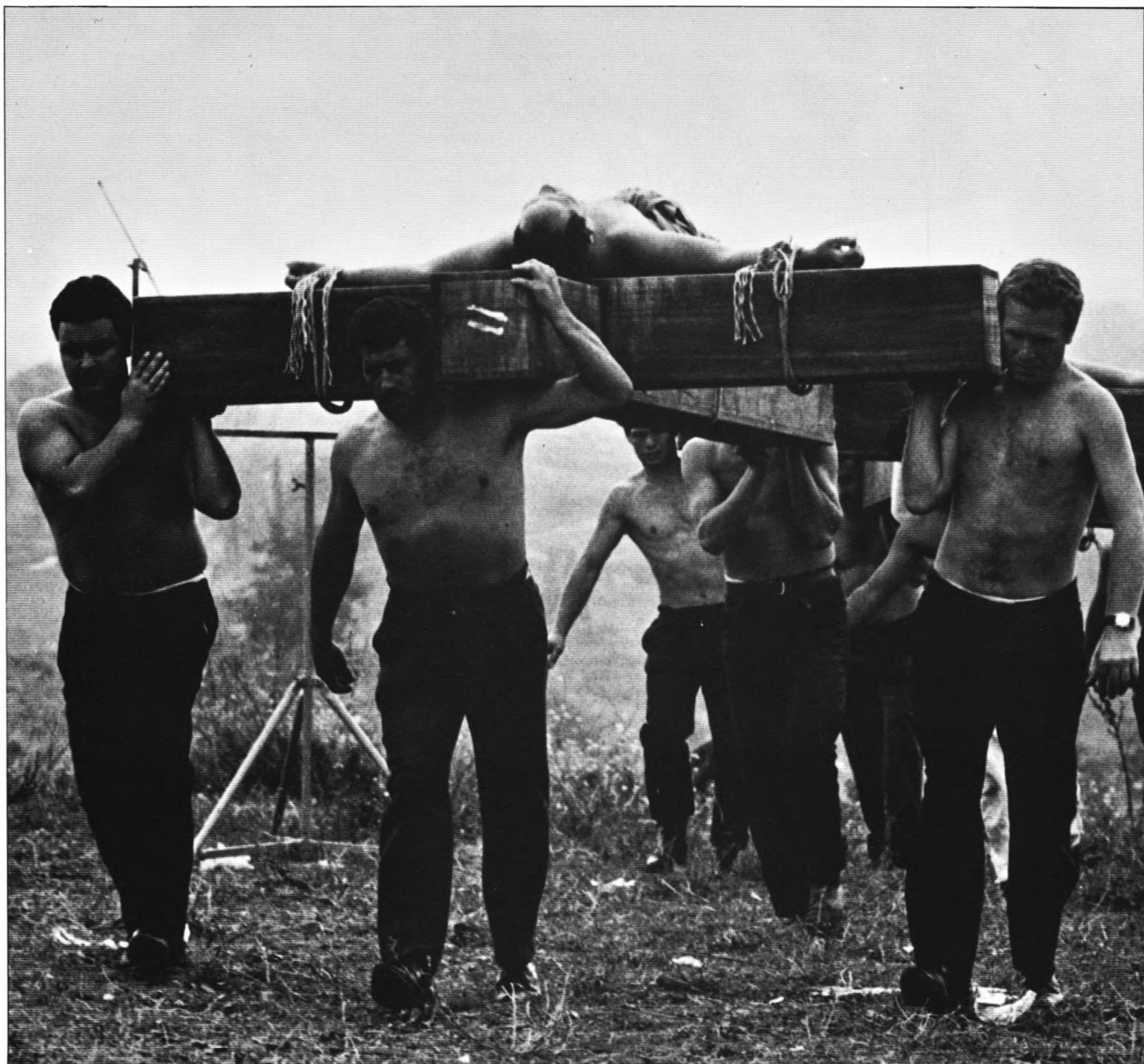
En scene fra Pier Paolo Pasolinis beklippede, men fortsat kontroversielle episode »La ricotta« i filmen »Rogopag«.