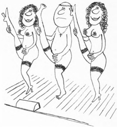
Den i anmeldelsen omtalte tegning af Siné.

Håndbogens emne – specialistens og entusiasgens gode råd til i filmnydelse mindre forfarne – og dens form – den afslappede dead pan -maske à la Buster Keaton – kunne en filmforfalden ætling af Chesterton have fået noget guddommeligt ud af, behændigt balancerende på grænsen mellem seriøst nonsens og poetisk common sense. Ado Kyrous lille vejledning består nemlig af en række alvorstunge kapitler om biogængeriets „teknik“ – meddeler på sin egen måde altså en slags filmkundskab, begrebet her forstået som biografvanernes nytte- og nydelsesæstetik. Samtlige enkeltafsnit kunne have haft en overskrift begyndende med et „Om at –“: „Om at stå i kø“, „Om at snyde sig ind“, „Om at ryge i smug“, „Om at omgås kvindelige kontrollører“, „Om at læse fortekster“, „Om at se dårlige film“, „Om at vælge film efter den pige man har med og ens hensigter med hende“, „Om at ytre bifald eller mishag“, „Om at lave skandale“ o. s. v. Man indstiller sig altså på forhånd på en god sofistikeret spøg med mening i, mander sig også op til et usikkert smil nu og da, men overgiver sig efterhånden helt til en foruroligende mistillid til sin egen fornemmelse for den subtilere humors valører. Tager manden virkelig sig selv så alvorligt, som det synes? Og emnet? Og os, læserne? Gudskelov bringer bogen selv et kraftigt dementi, som ganske vist slår forfatteren på munden, men som til gengæld redder læse-