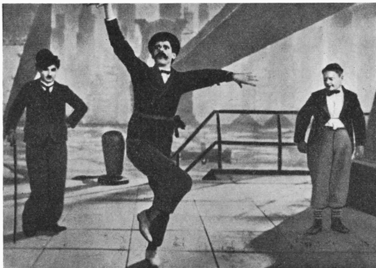
Cherkasov (i Danmark ofte stavet Tjerkassov) som Fyrtaarnet i „Koncert nr. 1“.

at han er en af Sovjets mest ansete og populære scenskuespillere, udnævnt til Folkets Kunstner. Man skulle derfor mene, at han kunne have adskilligt interessant at berette om de betydende kunstnere han har arbejdet sammen med, ikke mindst på film, og om skuespillerens stilling i den kommunistiske stat.