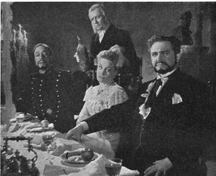
Fra Hasse Ekmans parodifilm „Ratataa“. Det er ikke svært at se, hvilken Bergman-film der her parodieres. „Ratataa“ bedder på dansk: „Skor efter noder“.

Dødedans i Ingmar Bergmans „Det sjunde inseglet“, der har vakt stor international interesse, og som danskerne forhåbentlig snart får at se.