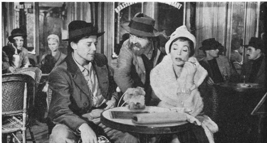
I Jacques Beckers nye film „Montparnasse 19“ spiller Gérard Philipe, der her ses til venstre, Modigliani. Til højre Lilli Palmer.