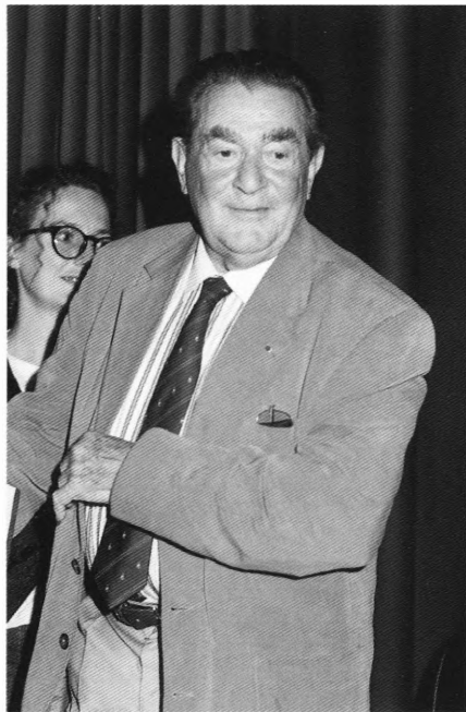
Den 87-årige Henri Alekan fra 'Scene by Scene' foredraget i forbindelse med festivalen.

som er blevet købt af praktisk taget hele verden med undtagelse af Storbritannien. Indtil videre har ingen britisk distributør turde binde an med filmens blanding af sex og voldelige bilsammenstød. Køen udenfor biografen var så lang, at flere troede, at den bestod af folk som skulle ind og se Independence Day . "Scene by Scene" er nok et af de største trækplastre i festivalen, og billetter til disse begivenheder når dårligt at komme på markedet, før de er udsolgt. Således også med Bertoluccis dissekering af The Conformist og Stealing Beauty og Greenaways gennemgang af The Pillow Book . Coenbrødrene spurgte sidste år om de ikke måtte få lov til at komme igen en anden gang, så det er ikke kun publikum, der synes, det er spændende at deltage.