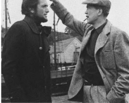
Moby Dick (1956) blev indspillet i Elstree – Gregory Peck og John Huston.