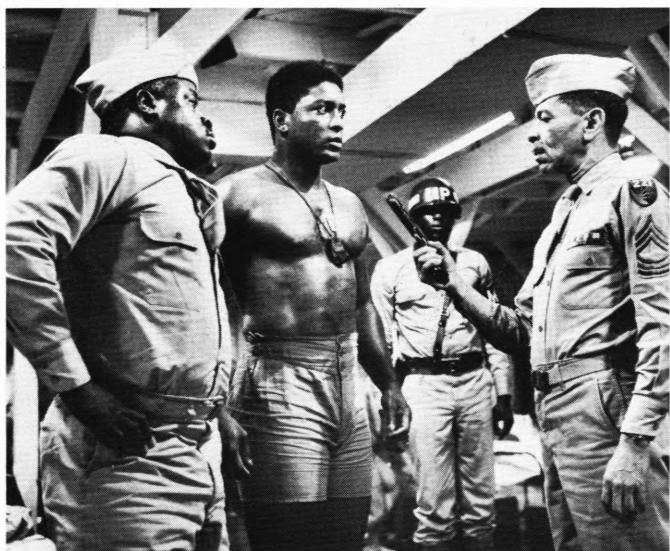
Herover Art Evans, Larry Riley og Adolph Caesar i en scene fra »A Soldier's Story«. Til højre Howard E. Rollins, Jr. i en scene fra filmen.

»A Soldier's Story« handler med andre ord om, hvad det vil sige at være sort: hvem – når vi ser et sådant væld af